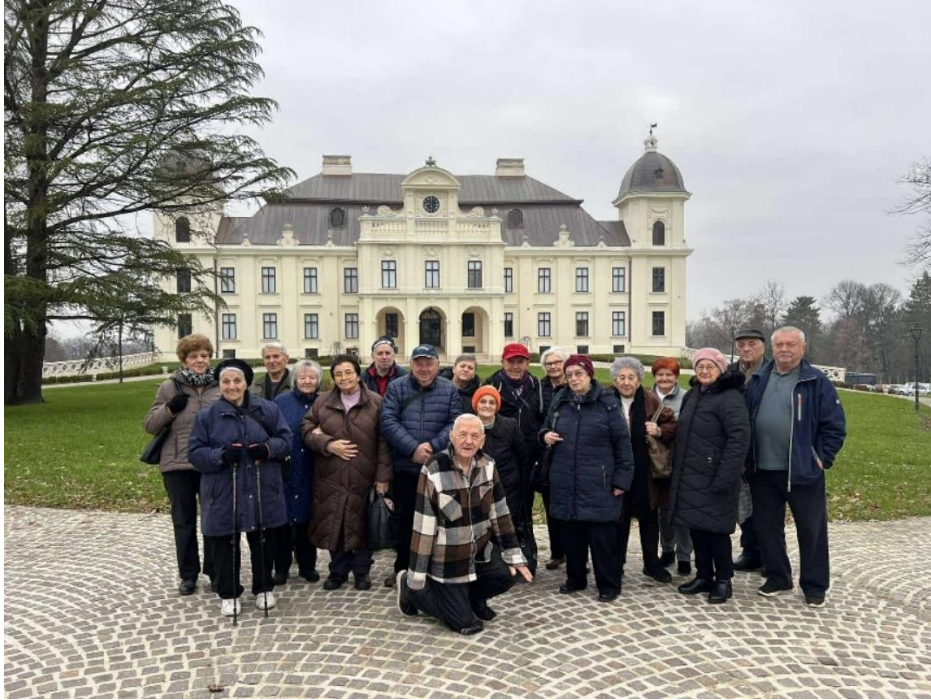
Slika 33 Izlet u Našice 2024. godine