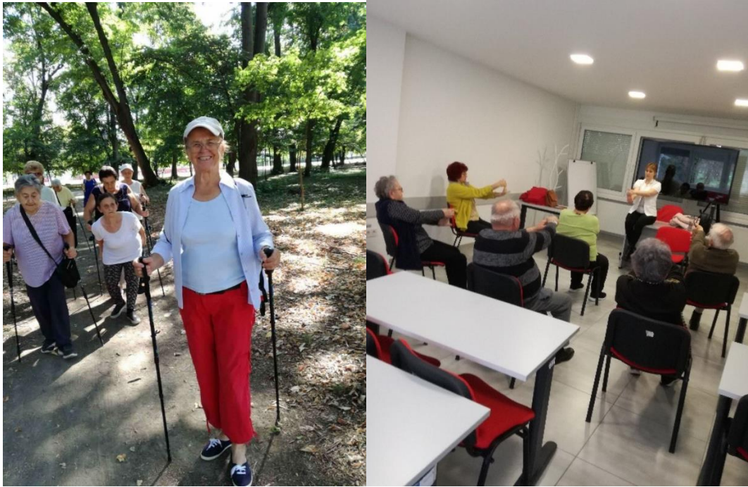
Slika 31 Nordijsko hodanje i tjelovježba 2024. godine

Povodom obilježavanja Međunarodnog dana starijih osoba, 1. listopada 2024. godine, Dnevni boravak GDCK Valpovo posjetili su korisnici Dnevnog boravka Općinskog društva Crvenog križa Darda. Susret su iskoristili za šetnju kroz Valpovački perivoj i posjet Muzeju Valpovštine te za druženje i razmjenu iskustava.