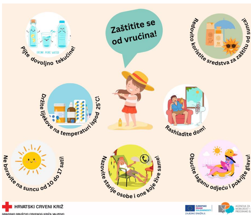
Slika 19 Letak za zaštitu zdravlja tijekom visokih temperatura

Tijekom 2024. godine, maturanti su se educirali o važnosti dobrovoljnog davanja krvi pa su u Srednjoj školi Valpovo održane 4 radionice za 74 učenika. Osim toga, volonteri GDCK Valpovo izradili su promotivni letak sa savjetima za očuvanje zdravlja tijekom visokih temperatura, a održano je i 9 radionica na temu prevencije ovisnosti kojima je obuhvaćeno 106 sudionika.