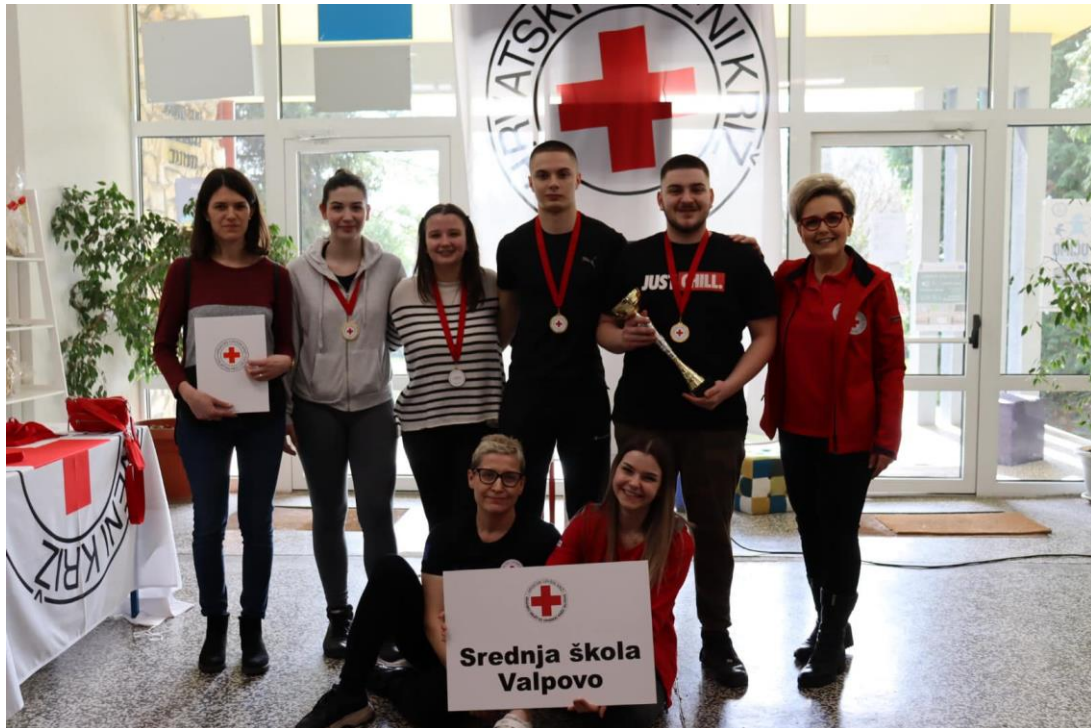
Slika 28 Ekipa u kategoriji mladih SŠ Valpovo s mentoricom na Gradskom natjecanju mladih HCK 2023. godina

Na međužupanijskoj razini koja je održana 13. travnja 2024. godine u Orahovici, ekipa Srednje škole Valpovo osvojila je 2. mjesto u kategoriji mladih dok je ekipa OŠ Ladimirevci osvojila 4. mjesto u kategoriji podmlatka