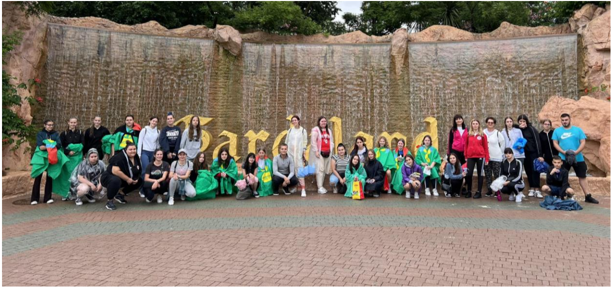
Slika 25 Gardaland