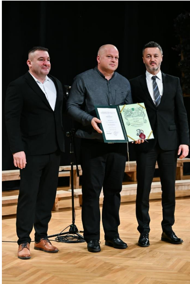
Slika 17 Zlatna plaketa "Pečat Grada Valpova", 8. prosinca 2024. godine