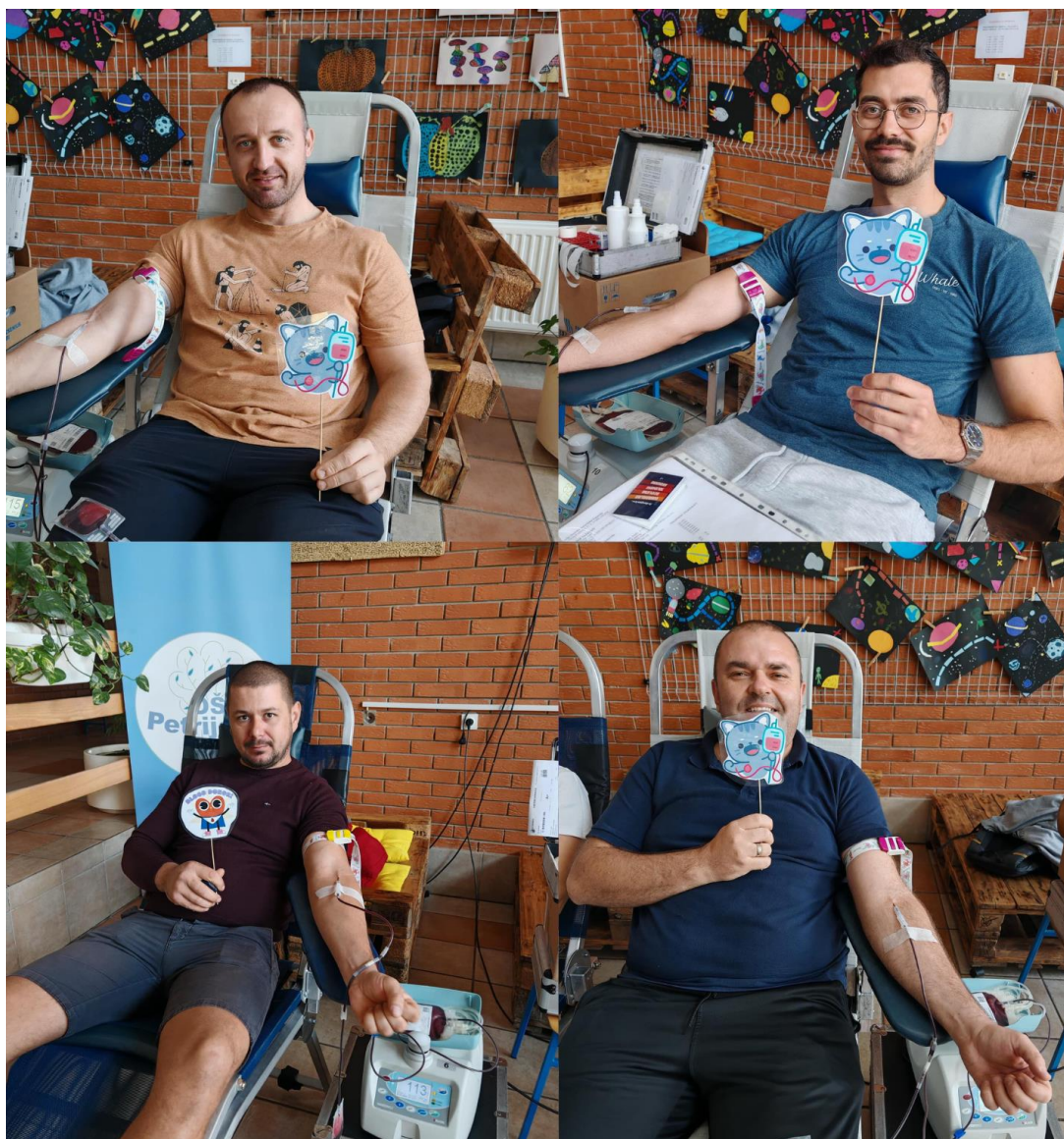
Slika 11 Akcije DDK u Petrijevcima

Nakon što akcije dobrovoljnog davanja krvi u Petrijevcima nisu bile uvrštene u plan akcija DDK za 2024. godinu od strane Kliničkog bolničkog centra Osijek, Kliničkog zavoda za transfuzijsku medicinu, pokrenuta je inicijativa stanovnika Petrijevaca i Satnice za održavanje akcija DDK četiri puta godišnje. Dana, 22. studenog 2023. godine, u Klinički zavod za transfuzijsku medicinu Osijek, poslana je Zamolba za promjenu rasporeda akcija dobrovoljnog davanja krvi za 2024. godinu s molbom da se u dostavljeni prijedlog DDK za 2024. godinu uvrste akcije DDK u Petrijevcima. Nakon što je telefonski odbijena, 8. prosinca 2024. godine poslana je nova zamolba s peticijom u prilogu. GDCK Valpovo, kao i stanovnici Petrijevaca, uvidjeli su da bi ukidanje akcija DDK u njihovom mjestu negativno utjecalo na percepciju važnosti davanja krvi, a što bi u konačnici rezultiralo smanjenjem motivacije za daljnjim doniranjem dragocjenih doza krvi. Ova inicijativa rezultirala je svrstavanjem dvije akcije u Petrijevcima u plan akcija DDK za 2024. godinu.