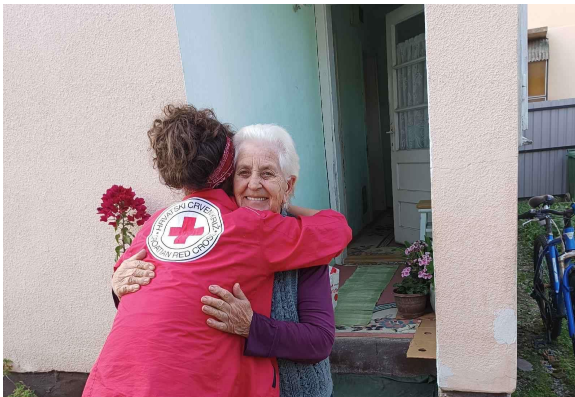
Slika 1 Pomoć u kući

Djelujući u skladu s temeljnim načelima Međunarodnog pokreta Crvenog križa i Crvenog polumjeseca, Hrvatski Crveni križ Gradsko društvo Crvenog križa Valpovo potiče dobrovoljnost i solidarnost, štiti dostojanstvo, život i zdravlje te bez diskriminacije pomaže čovjeku u potrebi 2 .