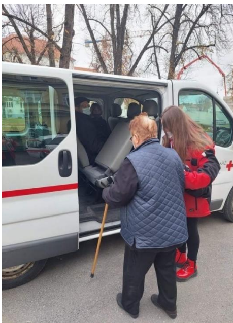
Slika 52 Usluga prijevoza korisnika