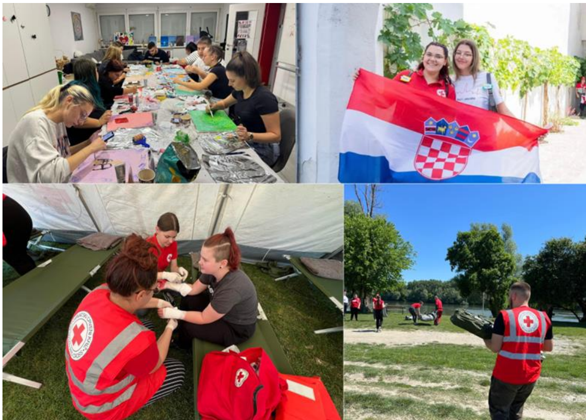
Slika 22 Aktivnosti Kluba mladih GDCK Valpovo u 2024. godini