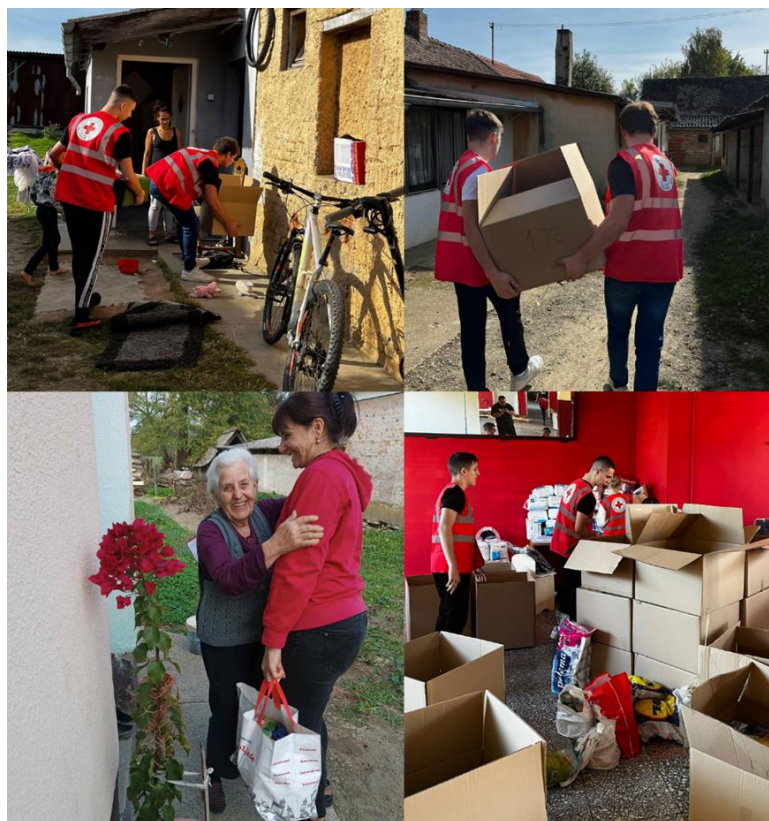
Slika 39 Solidarnost na djelu 2024.