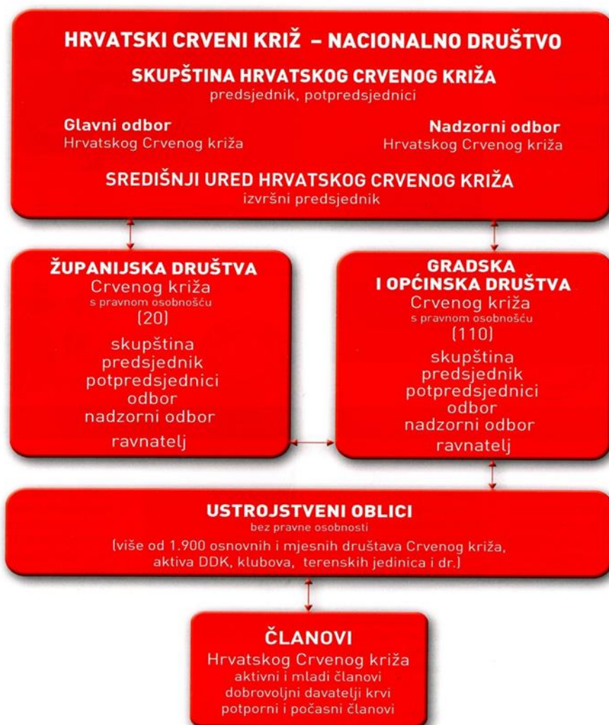
Slika 3 Ustroj i tijela HCK, Glasilo HCK

federacije društava Crvenog križa i Crvenog polumjeseca. 3 Sljedeća slika (Slika 3) prikazuje organizacijski ustroj i tijela HCK: