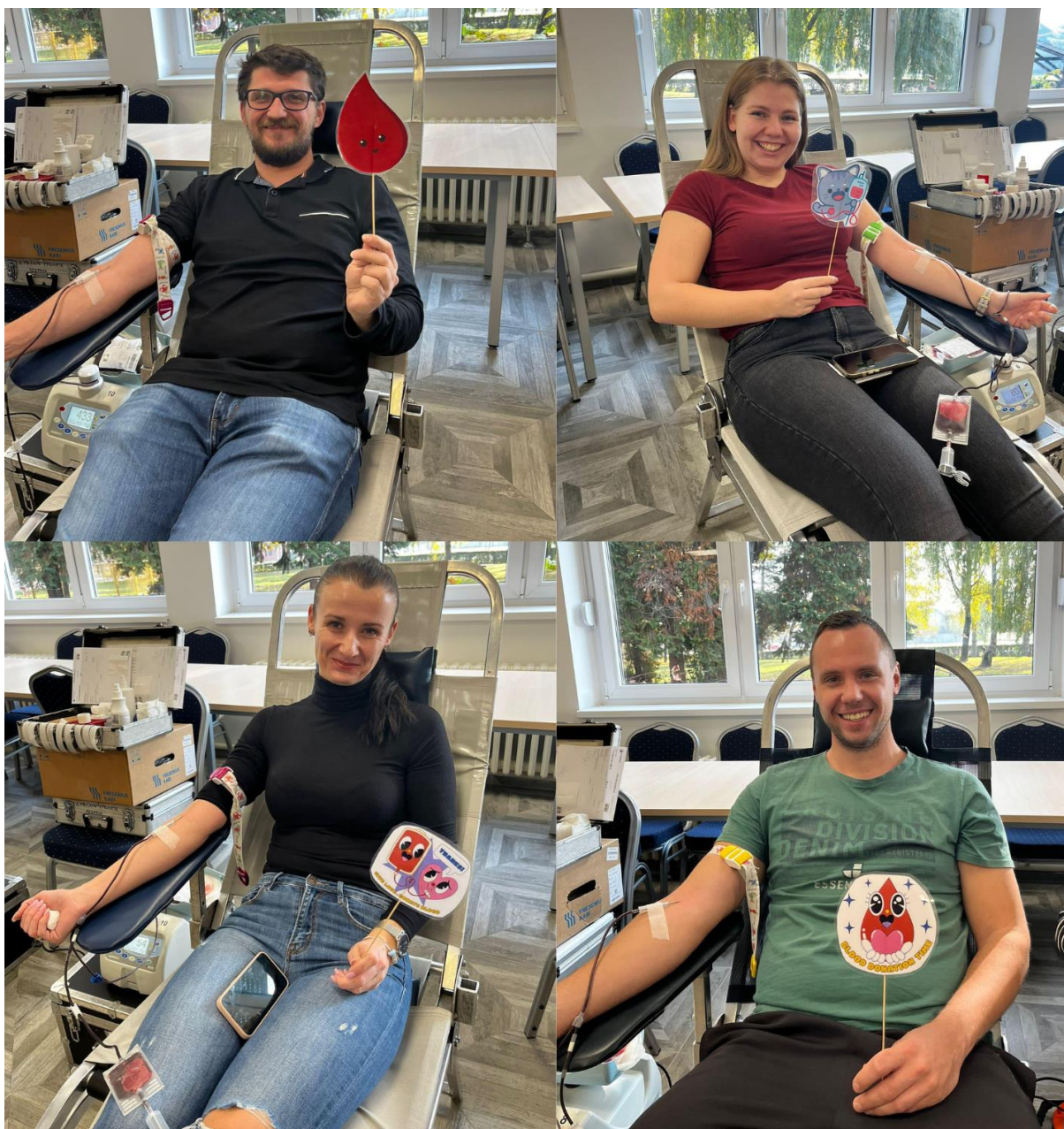
Slika 13 Akcija DDK u Belišću

Hrvatski Crveni križ Gradsko društvo Crvenog križa Valpovo, povodom Dana dobrovoljnih davatelja krvi u Republici Hrvatskog – 25. listopada, svake godine, tradicionalno organizira prigodnu svečanost. Prema Pravilniku o priznanjima Hrvatskog Crvenog križa koji je donesen na temelju članka 39. Statuta Hrvatskog Crvenog križa, dodjeljuju se priznanja Hrvatskog Crvenog križa za višestruko danu krv.