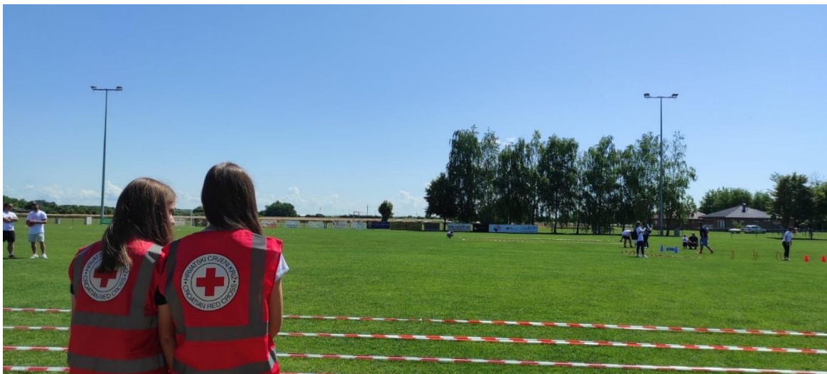
Slika 7 Dežurstvo na Dječjim sportskim igrama u Bizovcu 2024. godine