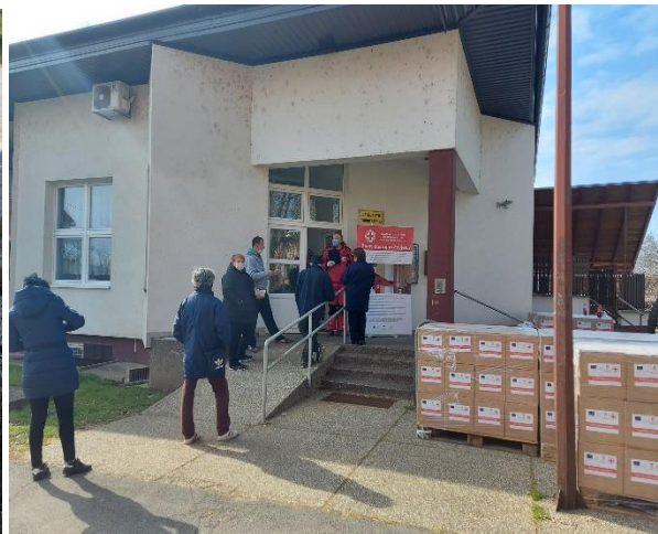
Slika 44 Podjela paketa Valpovo i Belišće, FEAD, 2021. godina