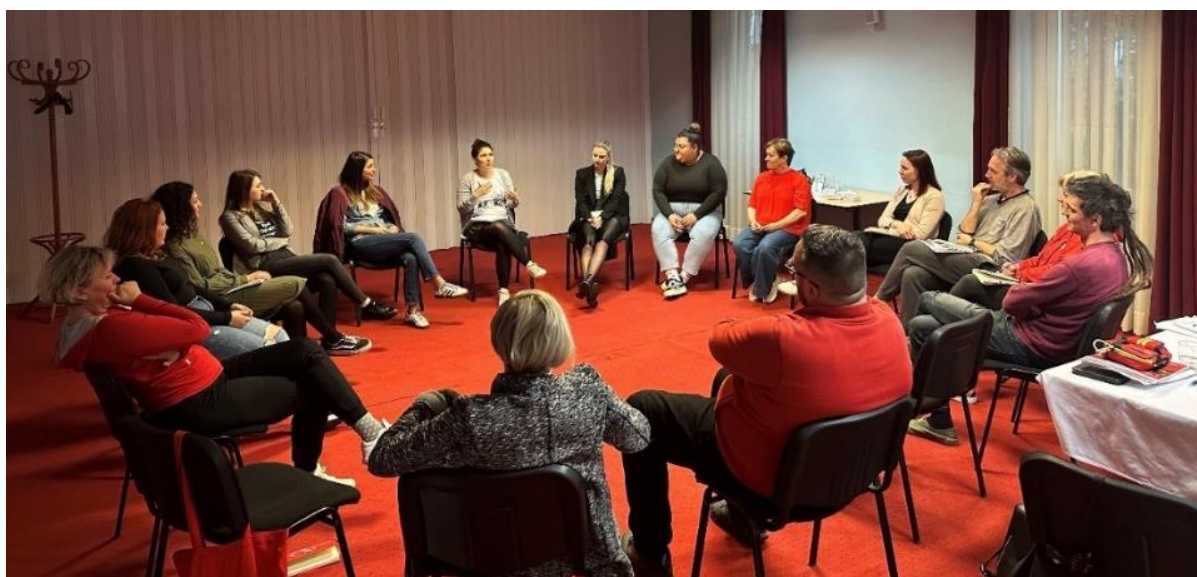
Slika 6 Trening za trenere "Psihosocijalna prva pomoć" 2024. godine

Tijekom 2024. godine, volonteri i zaposlenici GDCK Valpovo sudjelovali su na edukacijama za koordinate volontera, Odgoj za humanost od malih nogu, specijalističkoj edukaciji RPO-a, treningu za trenere vezanom uz psihološku prvu pomoć, treningu za trenere vezanom uz terensku jedinicu mladih, specijalističkoj edukaciji za povjerenike Službe traženja, edukaciji za pružanje psihosocijalne podrške u kriznim situacijama velikih razmjera te edukaciji vezanoj uz mentalno zdravlje i psihosocijalnu podršku u zajednici s naglaskom na rad s djecom.