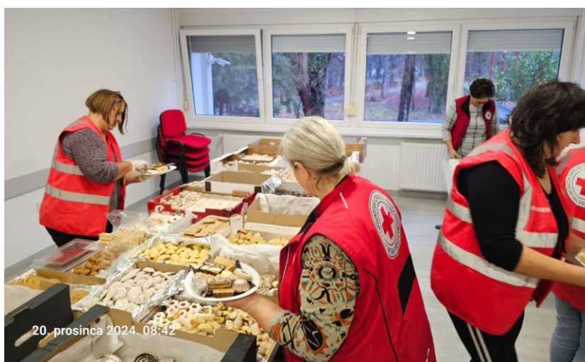
Slika 36 Priprema božićnih kolača za korisnik

Do smanjenja broja korisnika i isporučenih obroka došlo je zbog revizije postojećih Rješenja Zavoda za socijalni rad zbog čega dolazi do prestanka prava korisnika na pojedine usluge (organiziranje prehrane – priprema ili nabava gotovih obroka, organiziranje prehrane – dostava gotovih obroka, obavljanje kućnih poslova, održavanje osobne higijene i zadovoljavanje drugih svakodnevnih potreba).