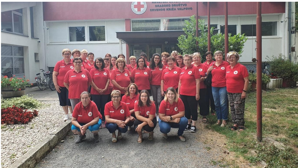
Slika 42 Zaposlenice u projektu „Dostojanstvena – snagom dobra za starije i nemoćne“

U rujnu 2021. godine 30 zaposlenica ciljne skupine završilo je odabrane programe osposobljavanja; 10 zaposlenica završilo je program osposobljavanja za gerontodomaćicu, 6 zaposlenica završilo je program osposobljavanja za njegovateljicu starijih i nemoćnih osoba i 14 zaposlenica završilo je program osposobljavanja za računalnog operatera.