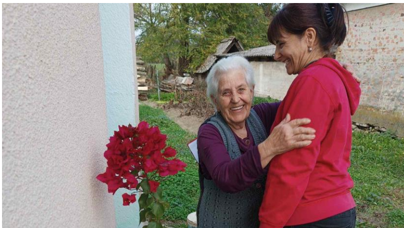
Slika 34 Pomoć u kući

Program Pomoć u kući provodio se u vlastitom domu korisnika za osobe starije od 65 godina koje su narušenog zdravstvenog stanja i socijalnog statusa i nemaju mogućnosti da im pomoć osiguraju članovi njihovih obitelji, a obuhvaća: obavljanje kućanskih poslova, održavanje osobne higijene (pomoć u oblačenju i svlačenju, kupanju i dr.) i higijene prostora, druge pomoći u vidu odlaska u trgovinu, kod liječnika i sl., te uređenje okućnice (cijepanje drva, košnja trave, čišćenje snijega i dr.). Osim redovnih djelatnosti zaposlenici programa Pomoći u kući, zajedno s volonterima, za korisnike su pripremali zimnicu, cijepali i unosili drva, pekli kolače za blagdane i dr. Cilj programa je stvoriti osjećaj sigurnosti i zadovoljstva kod korisnika, smanjiti osjećaj usamljenosti i nemoći te pridonijeti poboljšanju kvalitete života osoba starije životne dobi.