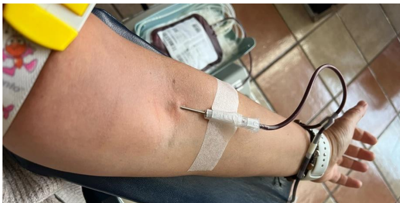
Slika 8 Dobrovoljno davanje krvi