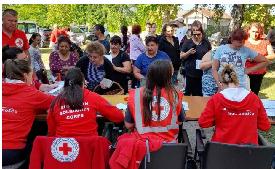
Slika 47 Podjela paketa u Belišću FEAD, 2023. godine