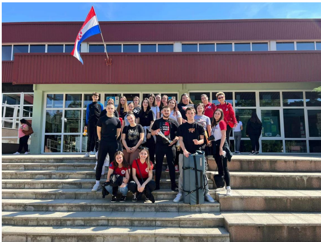
Slika 29 Ekipa iz kategorije podmladak OŠ Ladimirevci, ekipa iz kategorije mladih SŠ Valpovo i volonteri GDCK Valpovo na Međužupanijskom natjecanju mladih HCK 2024. godine

Na međužupanijskoj razini koja je održana 13. travnja 2024. godine u Orahovici, ekipa Srednje škole Valpovo osvojila je 2. mjesto u kategoriji mladih dok je ekipa OŠ Ladimirevci osvojila 4. mjesto u kategoriji podmlatka