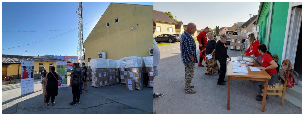
Slika 48 Podjela paketa u Bizovcu i Petrijevcima, FEAD, 2023. godina