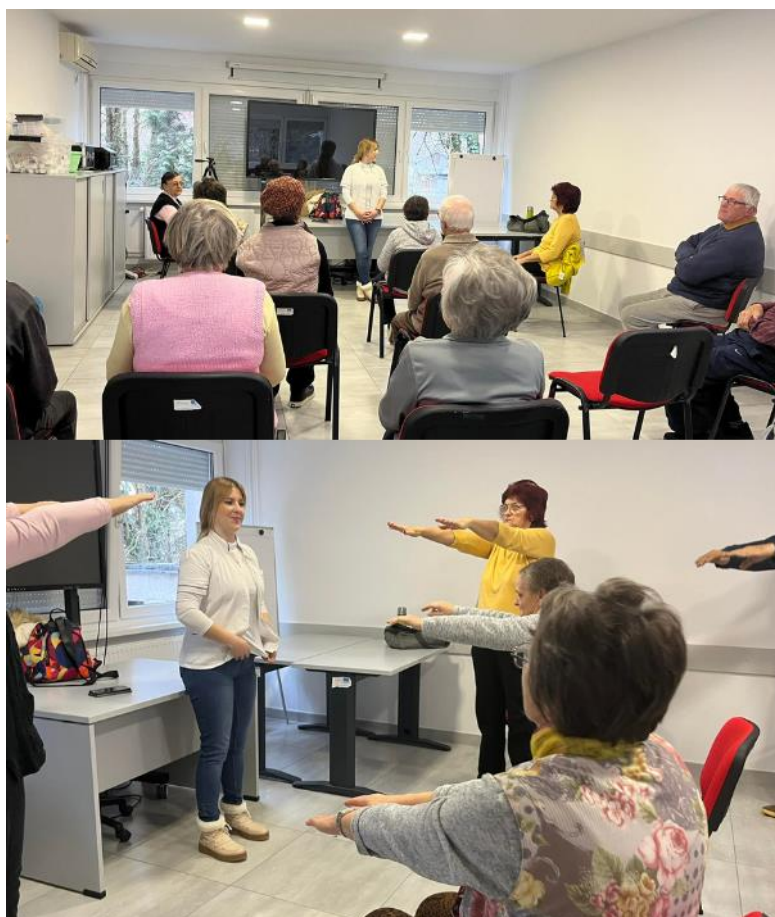
Slika 20 Tjelovježba s korisnicima Dnevnog boravka za osobe starije životne dobi 2024. godine

Tijekom 2024. godine broj aktivnih volontera u GDCK Valpovo je 114 od čega je 89 žena i 25 muškaraca. Volontera u dobi do 14 godina bilo je 21, u dobi od 15 do 17 godina 36, u dobi od 18 do 30 godina 42, u dobi od 31 do 45 godina 3, u dobi od 46 do 65 godina 10 te u dobi od 66 godina i više 2 volontera.