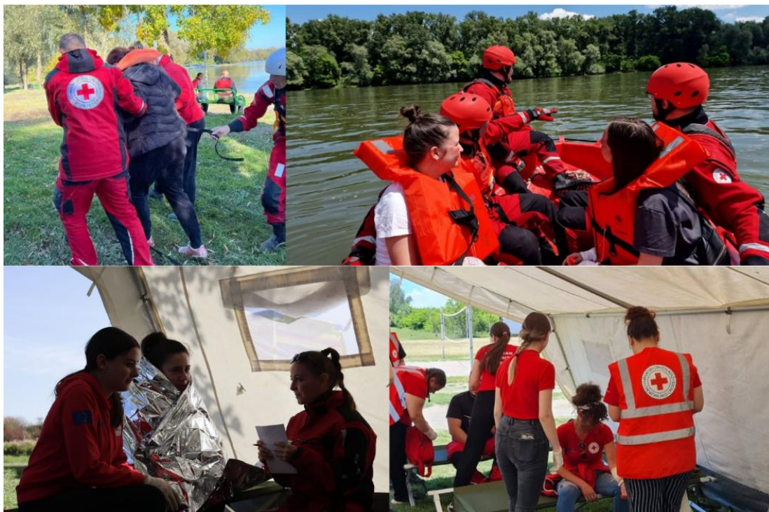
Slika 5 Pokazna vježba "Slavonija 2024" i „Slavonija 2024-2“

Tijekom 2024. godine, volonteri i zaposlenici GDCK Valpovo sudjelovali su na edukacijama za koordinate volontera, Odgoj za humanost od malih nogu, specijalističkoj edukaciji RPO-a, treningu za trenere vezanom uz psihološku prvu pomoć, treningu za trenere vezanom uz terensku jedinicu mladih, specijalističkoj edukaciji za povjerenike Službe traženja, edukaciji za pružanje psihosocijalne podrške u kriznim situacijama velikih razmjera te edukaciji vezanoj uz mentalno zdravlje i psihosocijalnu podršku u zajednici s naglaskom na rad s djecom.