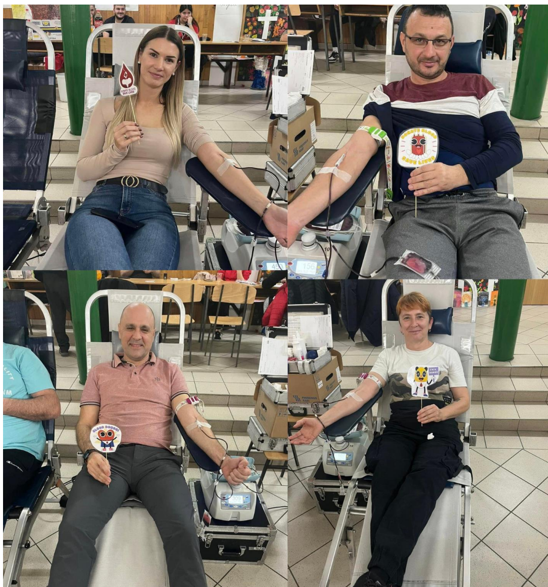
Slika 12 Akcija DDK u Ladimircima