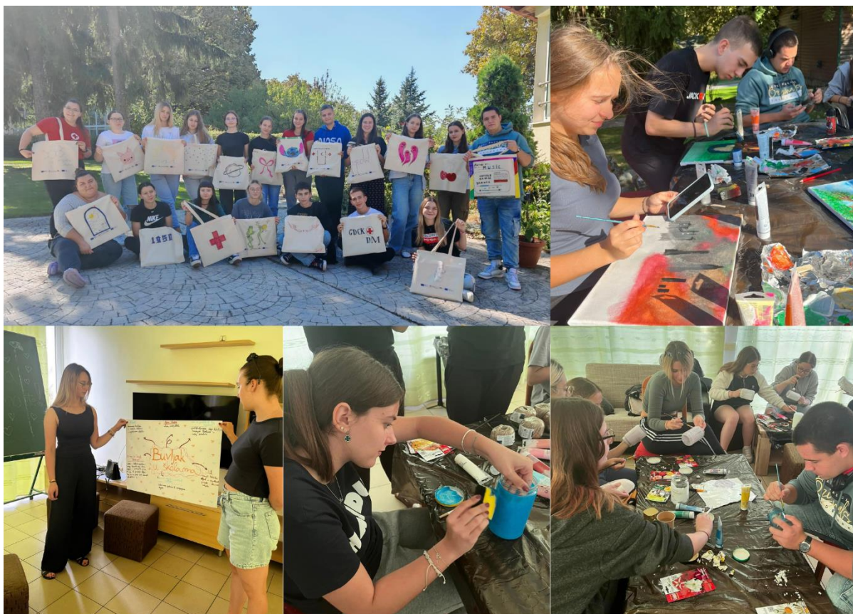
Slika 51 Edukacije u sklopu projekta "Educiraj, prenesi, zelenije sutra donesi"