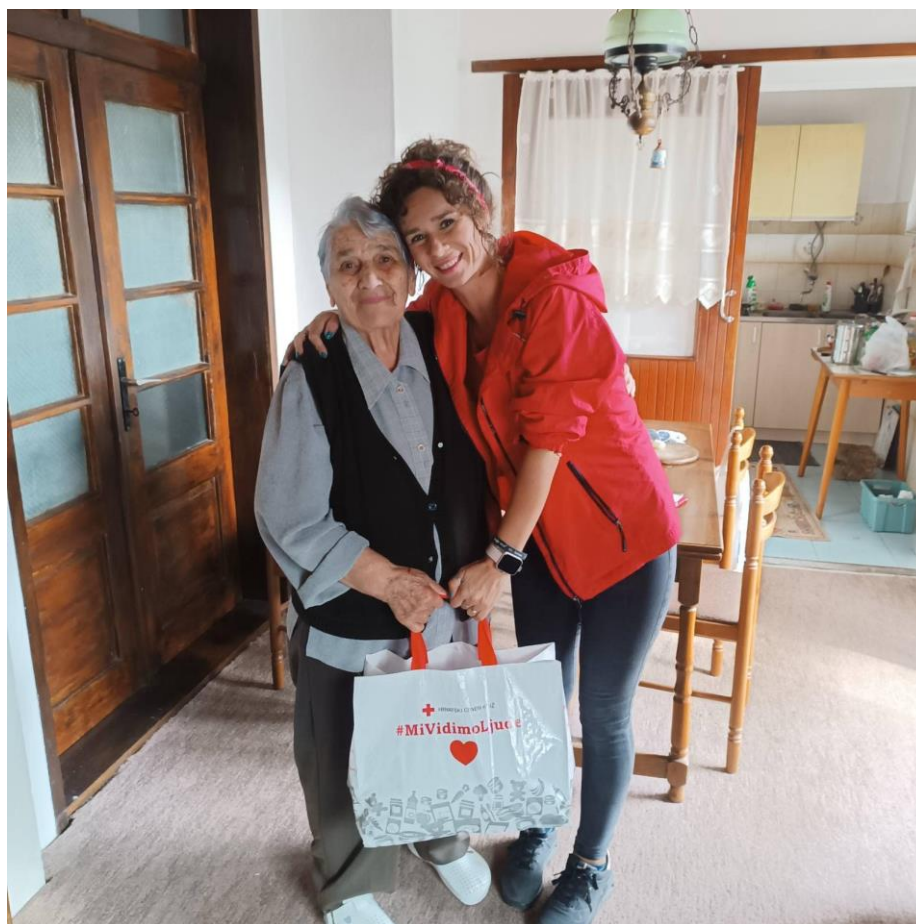
Slika 41 Podjela paketa