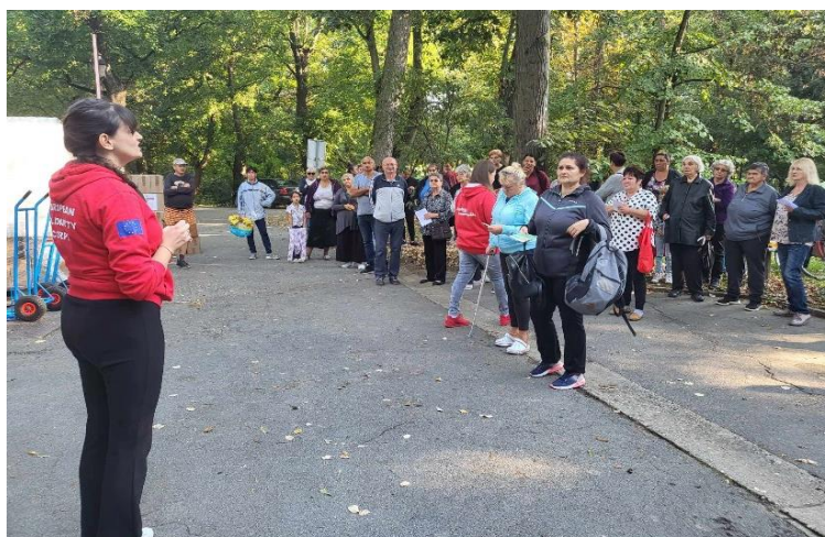
Slika 46 Podjela paketa u Valpovu FEAD, 2023. godina