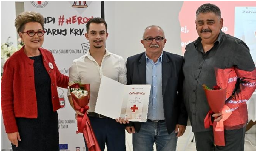
Slika 14 Obiteljska zahvalnica