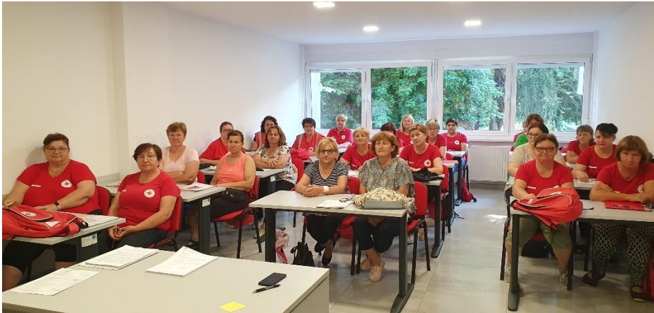
Slika 43 Zaposlenice na projektu "Dostojanstvena II - snagom dobra za starije i nemoćne"

Projektom je obuhvaćeno 107 korisnika s područja grada Valpova i prigradskih naselja; 42 korisnika s područja grada Belišća i prigradskih naselja; 2 korisnika s područja općine Petrijevc i prigradskih naselja te 14 korisnika s područja općine Bizovac i prigradskih naselja.