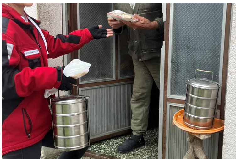
Slika 37 Dostava kuhanih obroka