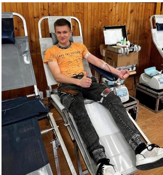
Slika 9 Akcija DDK Srednja škola Valpovo, 23. travnja 2024. godine

Promidžba i najave akcija obavljaju se putem: dopisnica, plakata, obavijesti u svim župama s područja Valpovštine na nedjeljnim misama, preko povjerenika i predsjednika mjesnih osnovnih društava Crvenog križa, mladih Crvenog križa, preko učenika u školama te obavijestima na službenim stranicama SŠ Valpovo.