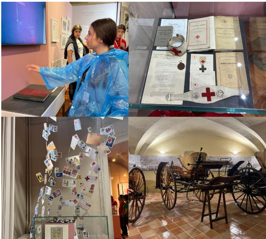
Slika 24 Muzej Crvenog križa

U središtu događanja je tradicionalna Fiaccolata (Bakljada), procesija u kojoj noseći baklje sedamnaest kilometara dugim putem od Solferina do Castiglionea sudjeluju mladi humanitarci te odaju počast svim poginulima, volonterima te Henryju Dunantu. Ovaj događaj okuplja volontere i mlade iz cijeloga svijeta, a među predstavnicima nacionalnih društava, na bakljadi u Solferinu sudjelovalo je 36 volontera i zaposlenika GDCK Valpovo. Među volonterima su bili i mladi sudionici natjecanja Hrvatskog Crvenog križa koji su se istaknuli s odličnim rezultatima. Već tada su pokazali svoje znanje, volju i želju za učenjem i sudjelovanju aktivnostima Crvenog križa. U koliko veliku organizaciju su uključeni mogli su vidjeti na samoj bakljadi gdje je sudjelovalo oko 15.000 volontera i zaposlenika Crvenog križa i Crvenog polumjeseca iz cijelog svijeta. Zajedničkim snagama volonteri i zaposlenici su prošli nekoliko vremenskih neprilika te osjetili duh zajedništva koji je prve volontere održao na okupu te im dao snagu da pomognu onima kojima je to bilo najpotrebnije.