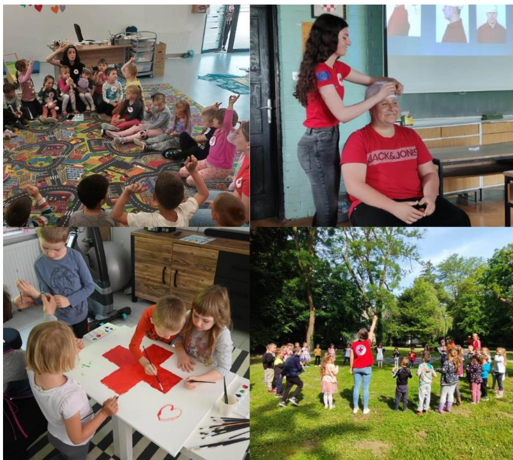
Slika 50 Radionice u osnovnim i srednjim školama te vrtićima sklopu projekta "Ja, volonter"

su, osim edukacije, dobili i želju za volontiranjem te su udruge na području Valpovštine zabilježile značajan porast broja volontera.