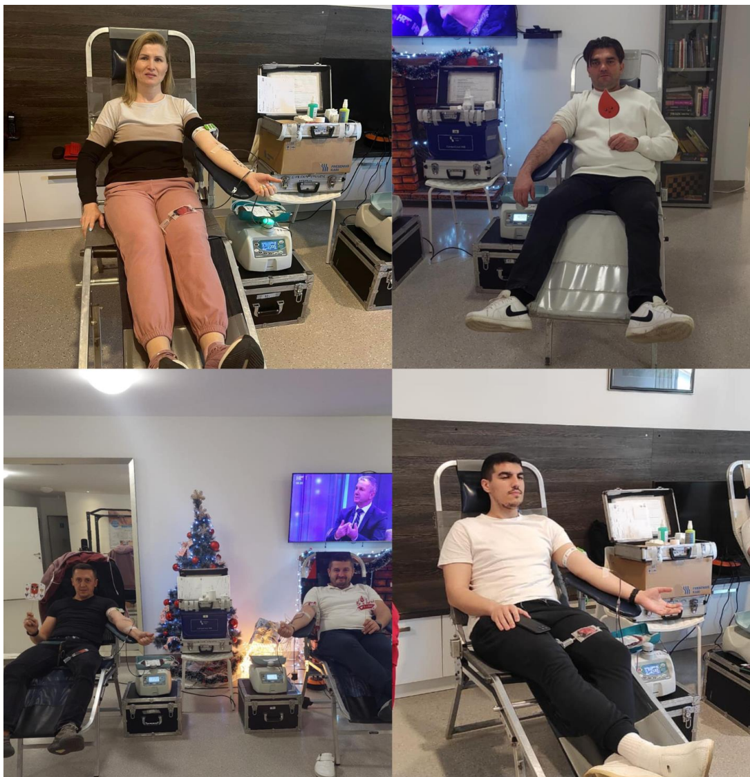
Slika 10 Akcije DDK Bizovac

Tijekom 2024. godine GDCK Valpovo organiziralo je i provelo 25 akcija dobrovoljnog davanja krvi.