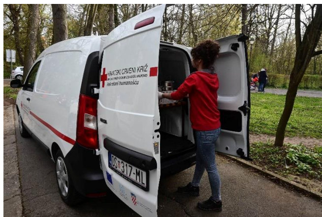
Slika 35 Dostava kuhanih obroka

Osim što korisnici kroz ovaj program dobivaju topli obrok, svaka dostava nosi i nešto više – ljudsku bliskost i osjećaj zajedništva. Volonteri i djelatnici GDCK Valpovo ne samo da donose obrok, već i osmijeh, pažnju i trenutke razgovora koji mnogima uljepšavaju dan. U trenucima kada su osamljenost i teškoće svakodnevice često prisutni, ta mala gesta otvaranja vrata postaje iznimno značajna.