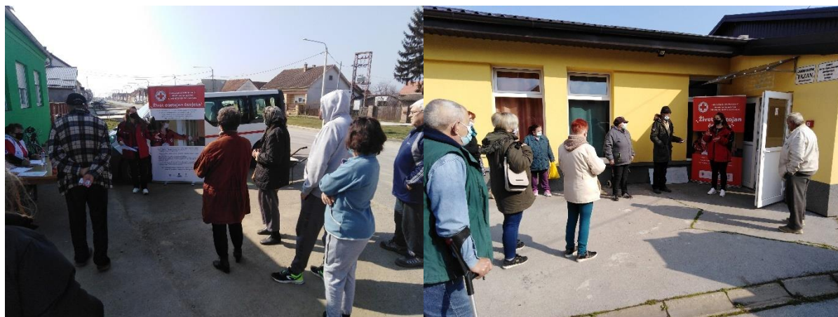
Slika 45 Podjela paketa u Petrijevcima i Bizovcu, FEAD, 2021. godina

GDCK Valpovo provelo je popratne aktivnosti projekta neposredno prije podjela paketa koje su se odnosile na održavanje edukativnih radionica od strane educiranih zaposlenika i volontera GDCK-a Valpovo, uključujući i socijalne mentorice. Edukativne radionice bile su različitih tema, kao što su: osobna higijena u doba pandemije COVID-19, dobrovoljno davanje krvi, pravilna i zdrava prehrana, trgovanje ljudima, prevencija ovisnosti, prva pomoć, sigurno ponašanje na internetu i upravljanje kućnih budžetom.