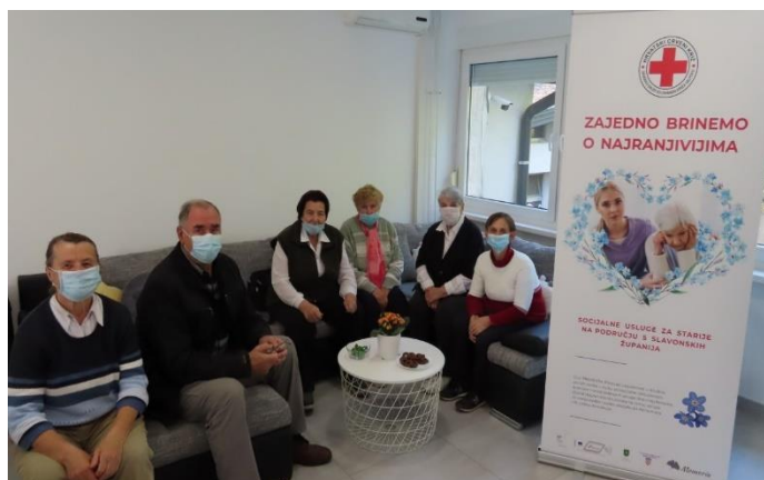
Slika 53 Korisnici dnevnog boravka