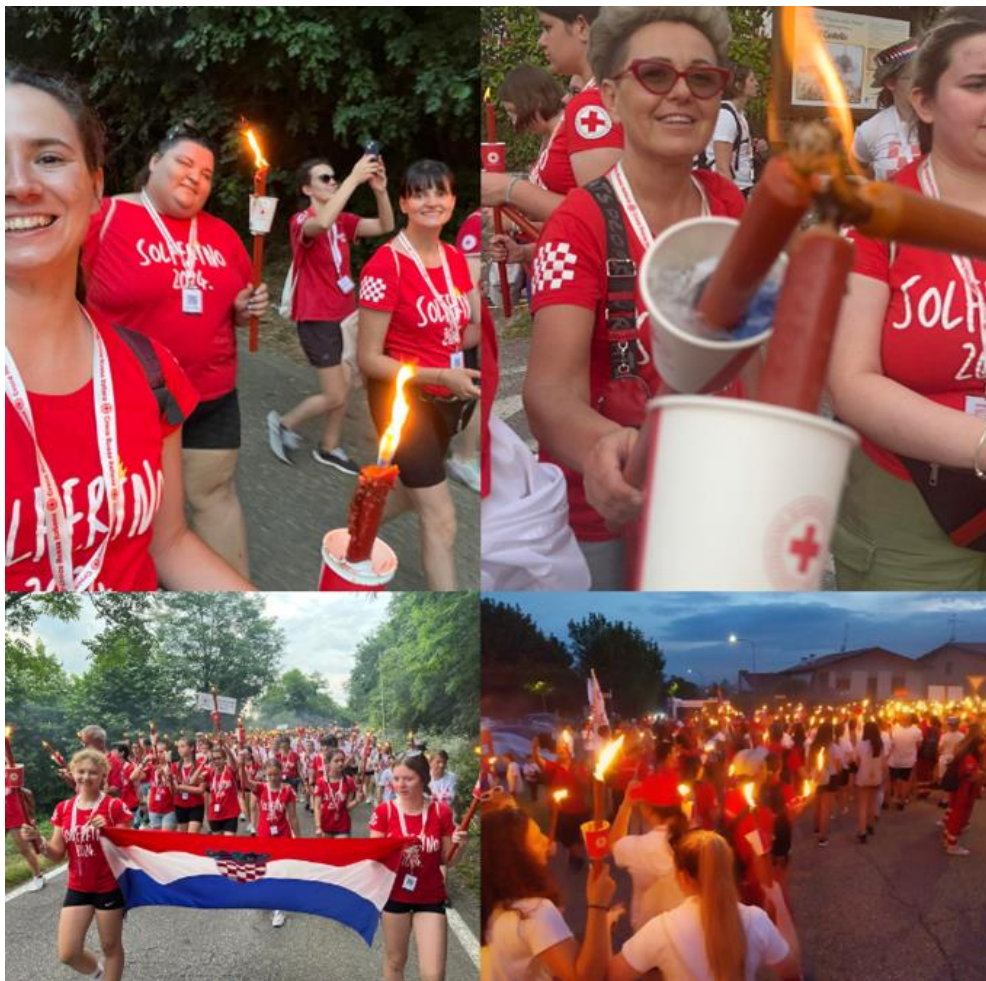
Slika 23 Fiaccolata (Bakljada)

Dana 24. lipnja 1859. kod mjesta Solferino sukobilo se oko 300 tisuća vojnika carske Austrije i francusko-sardinijskog saveza, a nakon bitke na bojnopolju je ostalo ležati oko 40.000 mrtvih, umirućih i ranjenih vojnika kojima nitko nije pružao pomoć. Slučajno se zatekavši na tom mjestu, užasnut stradanjima i prizorima ranjenih vojnika koji su umirali zbog manjka zdravstvenih djelatnika i sanitetskog materijala, Henry Dunant se angažirao i zajedno s lokalnim stanovništvom organizirao pomaganje svima bez obzira kojoj strani u sukobu pripadali. Utočište i bolnicu za ranjenike su pripremili u crkvi u mjestu Castiglione delle Stiviere. To iskustvo potaknulo ga je na razmišljanje te zaključak da je potrebno u svim zemljama organizirati društva koja bi u mirnodopskom vremenu educirala sanitetsko osoblje, isticala važnost zaštite ranjenika bez obzira kojoj strani u sukobu pripadaju te važnost sklapanja međunarodnih ugovora koji bi propisali rad nacionalnih društava i pri tome omogućili poštovanje njihove neutralnosti. Pokret koji danas obuhvaća skoro cijeli svijet djeluje u 191 zemlji u svijetu putem nacionalnih društava Crvenog križa i Crvenog polumjeseca koja okupljaju milijune članova i volontera. U znak zahvalnosti svima koji su ideju Crvenog križa prihvatili kao misao vodilju, Talijanski Crveni križ i Međunarodna federacija Crvenog križa i Crvenog polumjeseca 2024. godine su od 21. do 23. lipnja u Solferinu i Castiglione delle Stiviereu organizirali skup volontera Crvenog križa.