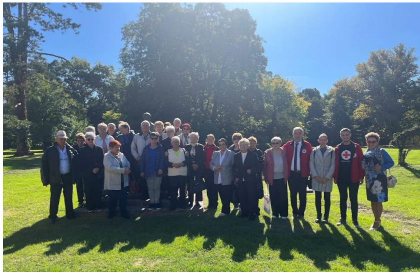
Slika 32 Korisnici Dnevnog boravka ODCK Darda u posjeti Dnevnom boravku GDCK Valpovo 2024. godine

Povodom obilježavanja Međunarodnog dana starijih osoba, 1. listopada 2024. godine, Dnevni boravak GDCK Valpovo posjetili su korisnici Dnevnog boravka Općinskog društva Crvenog križa Darda. Susret su iskoristili za šetnju kroz Valpovački perivoj i posjet Muzeju Valpovštine te za druženje i razmjenu iskustava.