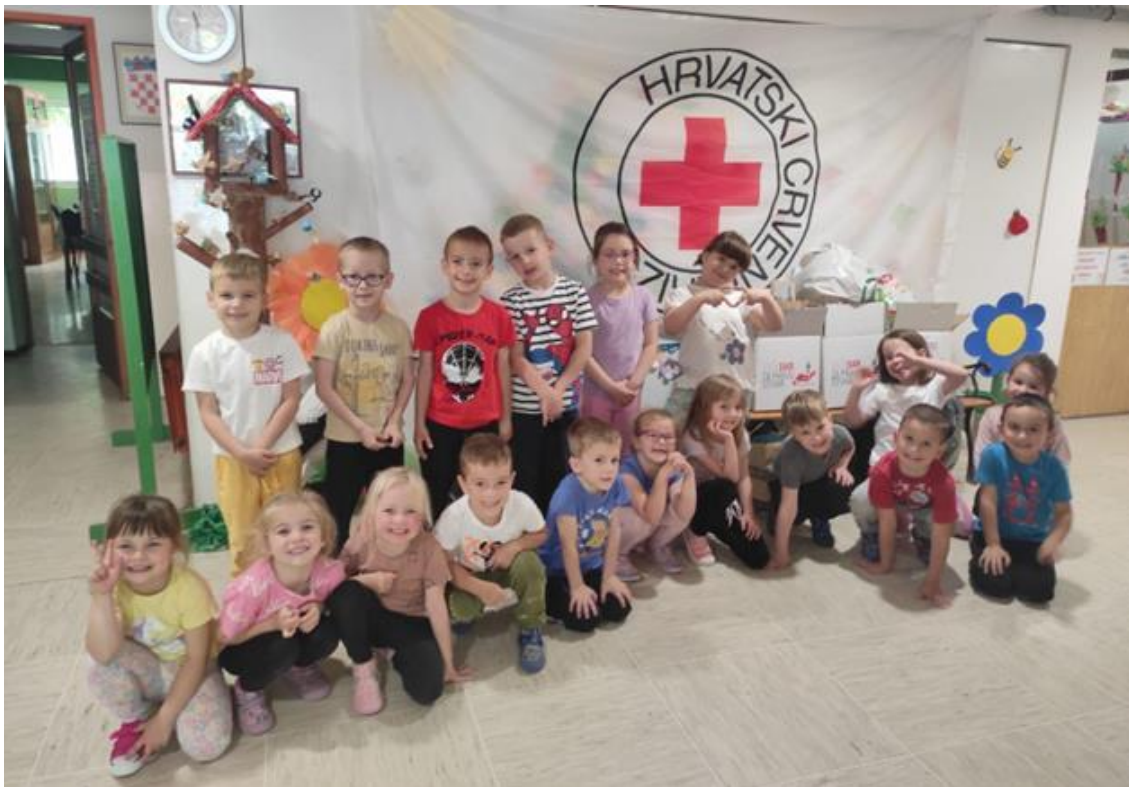
Slika 40 Donacija - Dječji vrtić Maza Valpovo

U 2024. godini kao i posljednjih 17 godina GDCK Valpovo primilo je donaciju ortopedskih pomagala od strane Udruge ljubitelja oldtimera „Veteranenfreunde Herlhem“ iz Njemačke. Nastavile su se i donacije za raseljene osobe kao i za ostale korisnike u potrebi. Dječji vrtić Maza Valpovo inicirao je pokretanje humanitarnu akciju prikupljanja rabljene odjeće, obuće i igračaka s ciljem pomoći obiteljima u potrebi. Kroz ovu inicijativu djeca razvijaju osjećaj solidarnosti, empatije i odgovornosti prema zajednici, učeći pritom o važnosti dijeljenja i brige za druge. Sudjelovanjem u akciji, najmlađi usvajaju vrijednosti humanosti i društvene odgovornosti, što doprinosi njihovom cjelokupnom odgoju i razvoju.