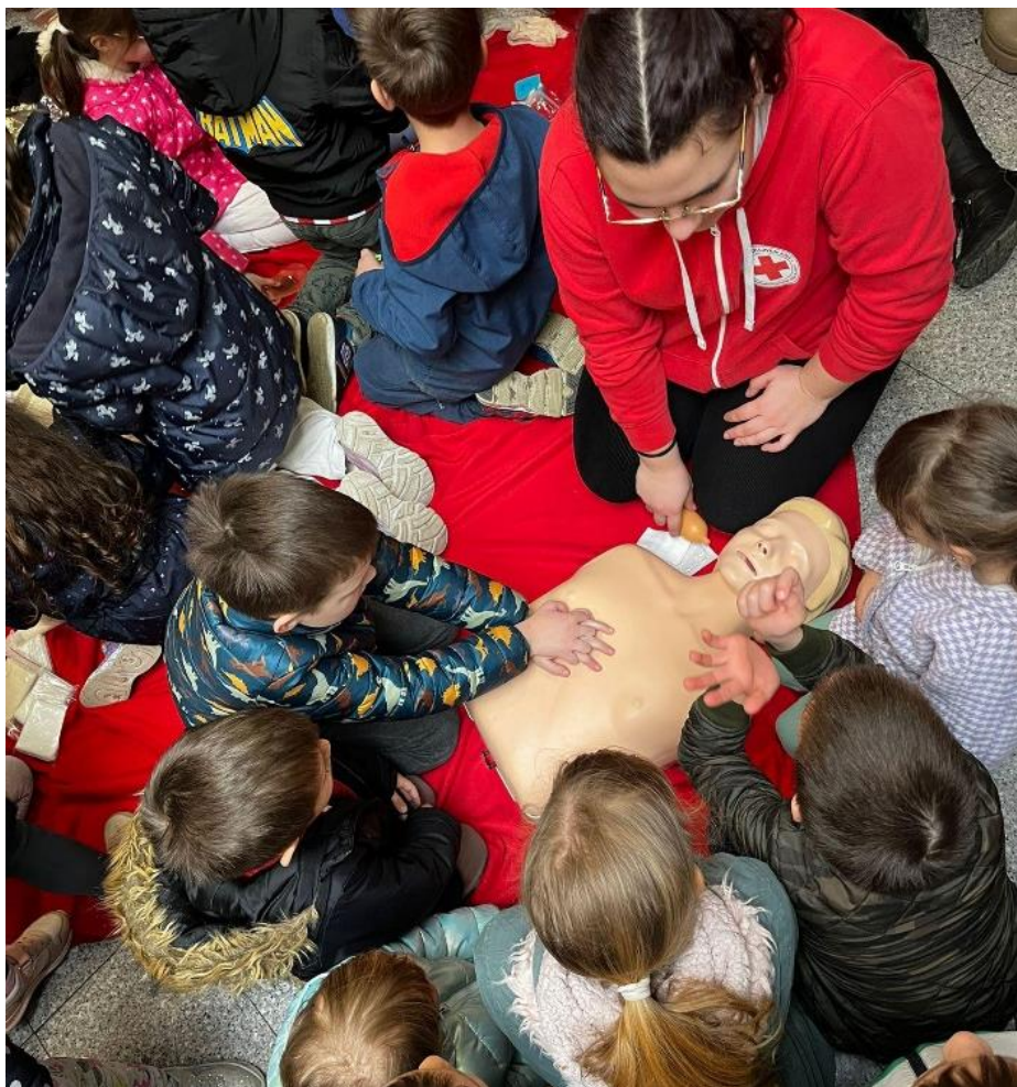
Slika 4 Edukacija iz prve pomoći na Obilježavanju međunarodnog dana CZ, Belišće