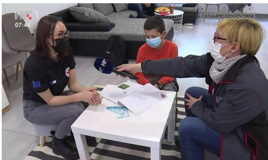
Slika 49 Snimanje priloga za HRT o projektu "Šeraj znanje, lajkaj budućnost"

Projekt pod nazivom „Šeraj znanje, lajkaj budućnost“, financiran od strane Agencije za mobilnost i programe EU iz programa Europskih snaga solidarnosti, provodio se od 1. kolovoza 2020. godine do 31. srpnja 2021. godine. Ugovoreni iznos bio je 6.888,00 €, a cilj projekta bila je integracija djece prilagođenog programa, edukacija učenika srednjih strukovnih škola u pisanju i ispunjavanju administrativnih formi prije odlaska na tržište rada, grupno i interaktivno učenje. Krajnji korisnici bila su djeca slabijeg imovinskog stanja, a provedbom projekta direktno se doprinijelo borbi protiv diskriminacije i olakšala se integracija u školski sustav. U sklopu projekta ostvareno je 97 sati instrukcija za 23 učenika (Valpovo-15, Gorica Valpovačka-1, Bistrinci-7), a najčešće su bile iz predmeta: matematika, fizika, kemija, hrvatski i engleski jezik. Odrađena su i 32 sata pripreme i provedbe radionica Crvenog križa te pomoći u pisanju životopisa i zamolbi za posao. Za potrebe kvalitetnog provođenja instrukcija, opremljena je prostorija u GDCK Valpovo sa svim potrebnim materijalima, koja nakon završetka projekta služi kao prostorija Kluba mladih.