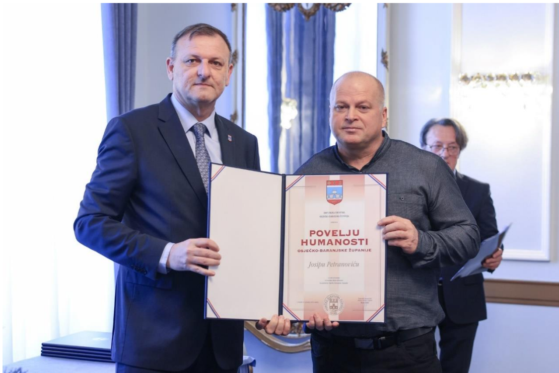
Slika 18 Povelja humanosti OBŽ, 16. prosinca 2024. godine