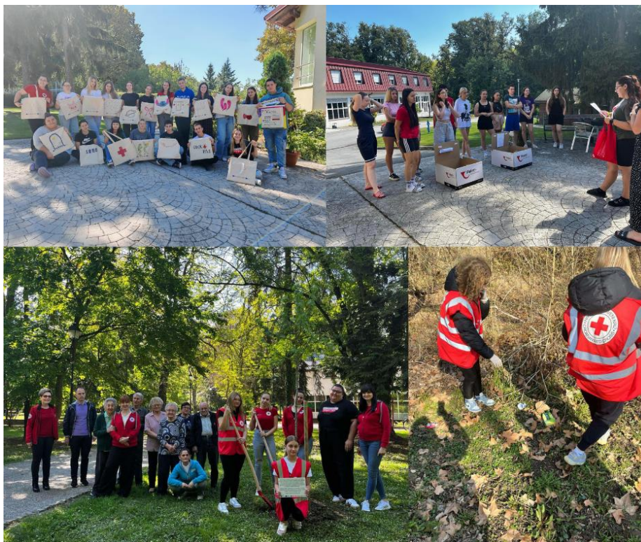
Slika 22Aktivnosti u okviru projekta ESS "Educiraj, prenesi, zelenije sutra donesi" 2025. godine

Mladi GDCK Valpovo veliko iskustvo imaju i u provedbi projekata financiranih od strane Agencije za mobilnost i programe EU iz programa Europskih snaga solidarnosti. Tijekom prve polovice 2025. godine proveli su projekt „Educiraj, prenesi, zelenije sutra donesi“, koji je financiran sredstvima Europske unije iz programa Europskih snaga solidarnosti. U okviru projekta provedene su brojne edukativne i praktične aktivnosti usmjerene na podizanje svijesti o klimatskim promjenama i poticanje održivih ponašanja kao i početna i završna anketa koje su pokazale značajan porast razine znanja i osviještenosti sudionika, pri čemu se udio ispitanika koji nisu bili svjesni utjecaja vlastitih aktivnosti na klimatske promjene smanjio s 47,2 % na 6,1 %, a više od 90 % sudionika navelo je da stečena znanja primjenjuje u svakodnevnom životu. Tijekom projekta održane su dvije edukacije za mlade s ukupno 31 sudionikom, provedeno je 25 radionica u školama i vrtićima s ukupno 421 sudionikom, izrađeni su digitalni i tiskani informativni letci o zaštiti od vrućina (100 primjeraka), organizirana radionica „Moj ugljični otisak“, provedena akcija čišćenja okoliša, održan edukativni pub kviz te realizirana sadnja stabala u suradnji s Gradom Valpovo, čime je ostvaren cilj projekta jačanja znanja, odgovornosti i aktivnog sudjelovanja djece, mladih i šire zajednice u području zaštite okoliša.