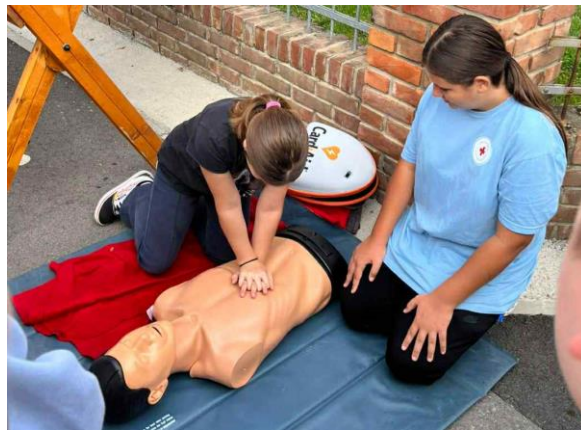
Slika 7 Svjetski dan prve pomoći