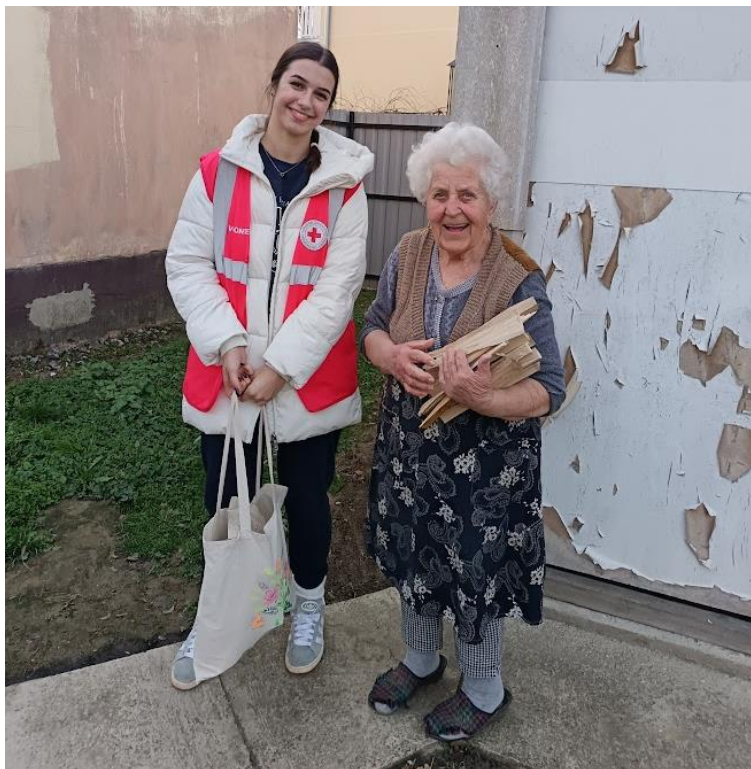
Slika 42 Podjela paketa

Distribucija humanitarne pomoći provodi se u skladu s raspoloživim sredstvima i stvarnim potrebama korisnika, čime se osigurava da svaka pomoć dođe onima kojima je najpotrebnija. Ovaj sustavni pristup omogućava učinkovitu raspodjelu i maksimalni učinak pružene podrške.