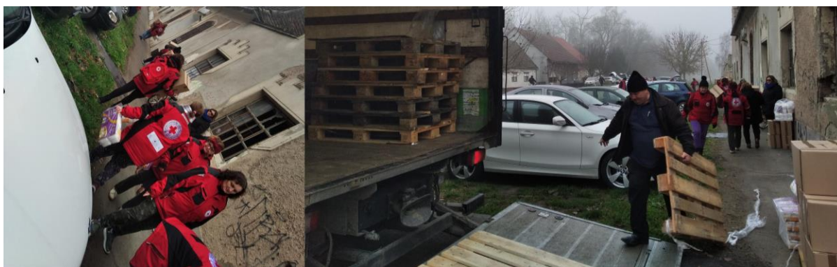
Slika 44. Podjela paketa kućanskih potrepština, Zaželi - Prevencija institucionalizacije.