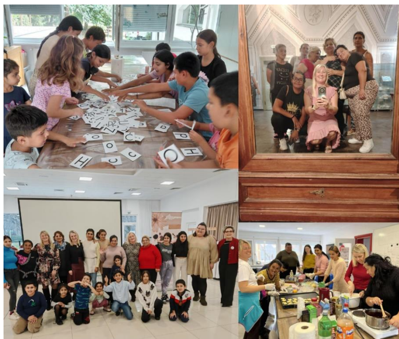
Slika 49 Aktivnosti u okviru projekta "Snažni i jednaki"