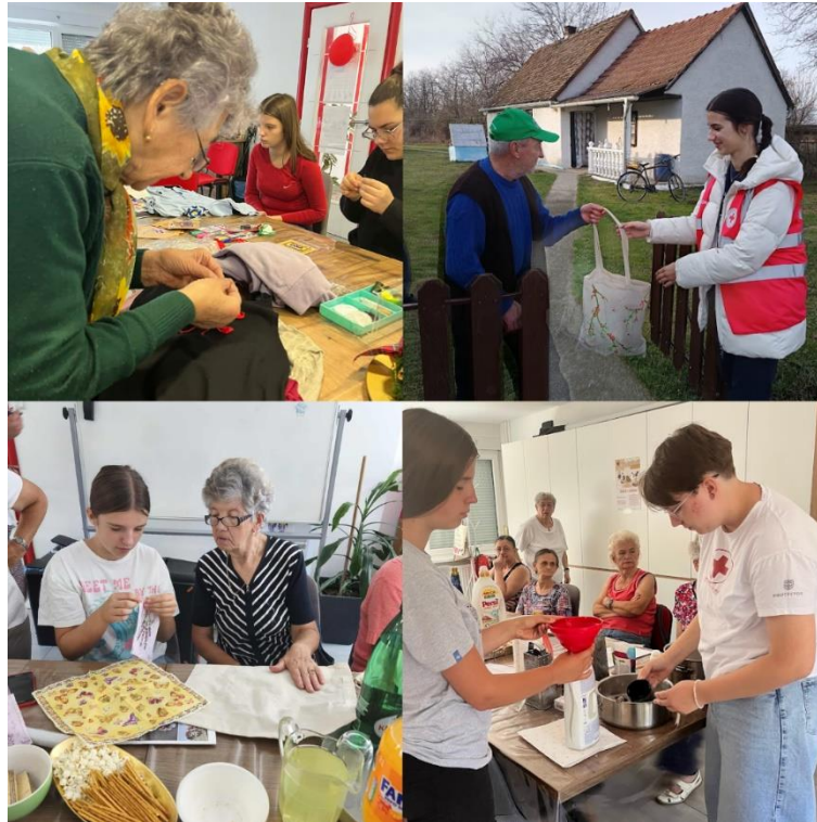
Slika 51 Aktivnosti "Eko-generacije - zajedno za održivu budućnost"