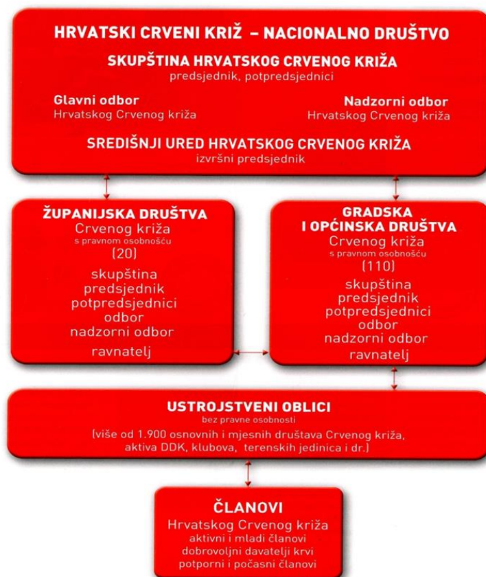
Slika 3 Ustroj i tijela HCK, Glasilo HCK