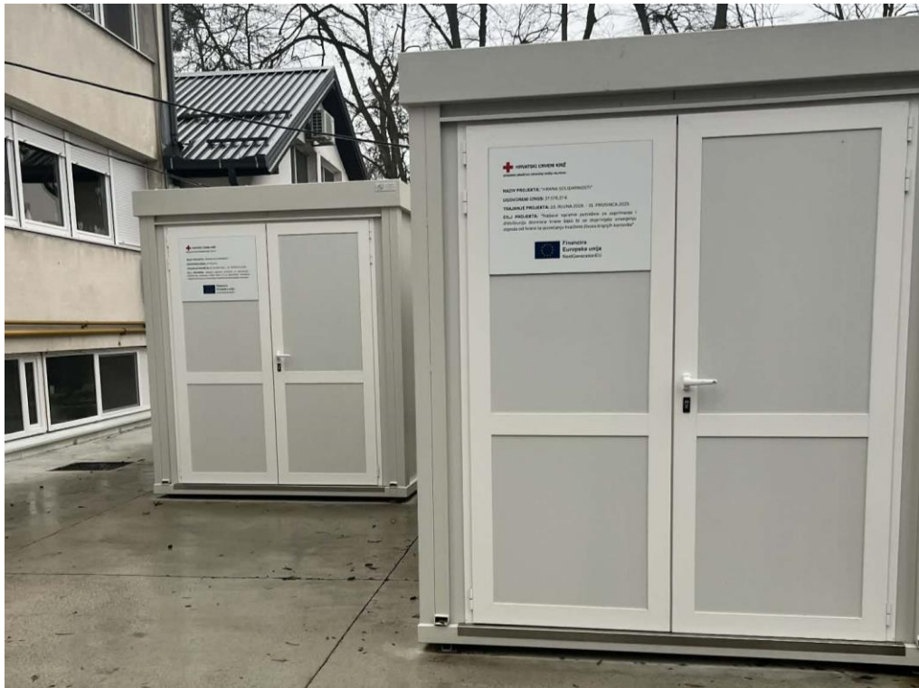
Slika 48 Kontejneri u sklopu projekta "HRANA SOLIDARNOSTI"