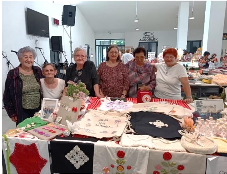
Slika 31 Korisnici Dnevnog boravka Crvenog križa Valpovo i njihovi radovi izloženi na 19. valpovačkom sajmu obrtništva i malog poduzetništva 20. rujna 2025.

Također, voditeljica Dnevnog boravka organizirala i dvije edukativne eko - radionice. Povodom Dana planeta Zemlje održana je radionica izrade eko omekšivača za rublje, dok je povodom Svjetski dan zaštite okoliša organizirana radionica izrade prirodnog deterdženta za rublje. Kroz radionice, uz savjete i recepte korisnici su se informirali i potaknuli na izradu vlastitih prirodnih i ekoloških sredstava za pranje rublja, koja su pohranjena u ponovno upotrijebljenoj plastičnoj ambalaži, čime se potaknulo na ponovno korištenje plastike i na smanjenje nepotrebnog otpada.