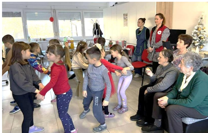
Slika 30 Druženje uz pjesmu i ples djece iz Dječjeg vrtića „Maza“ u Valpovu i korisnika Dnevnog boravka Crvenog križa Valpovo

Uspješna suradnja sa projektom Dnevni boravak – Crveni križ Valpovo ostvaren je i sa Dječjim vrtićem „Maza“ Valpovo, gdje su nas mališani iz vrtičke skupine „Bombončići“, posjetili i razveselili pjesmom, plesom i osmjesima čak tri puta, a i naši korisnici su ih iznenadili sa poklonima - ručno izrađenim štrikanim igračkama. Ove aktivnosti su doprinijele međugeneracijskoj suradnji i osjećaju pripadnosti starijih osoba, uz obostrane emocionalne dobrobiti i jačanju socijalnih veza.