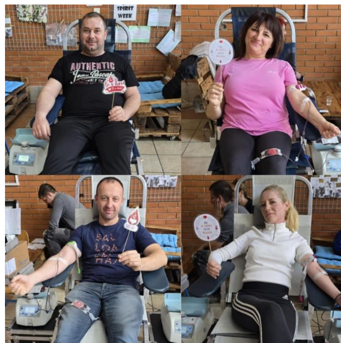
Slika 12 Akcije DDK u Petrijevcima

Akcije dobrovoljnog davanja krvi održavale su se na sljedećim lokacijama: DVD Belišće, Osnovna škola Ladimirevci, Osnovna škola Petrijevci, Lječilište Bizovačke toplice, Srednja škola Valpovo te Crveni križ Valpovo.