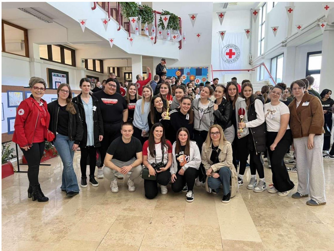
Slika 27 Ekipa iz kategorije podmladak OŠ Ladimirevci, ekipa iz kategorije mladih SŠ Valpovo, volonteri i zaposlenici GDCK Valpovo na Međužupanijskom natjecanju mladih HCK 2025. godine

Na međužupanijskoj razini koja je održana 12. travnja 2025. godine u Slatini, ekipa Srednje škole Valpovo osvojila je 3. mjesto u kategoriji mladih dok je ekipa OŠ Ladimirevci osvojila 3. mjesto u kategoriji podmlatka.