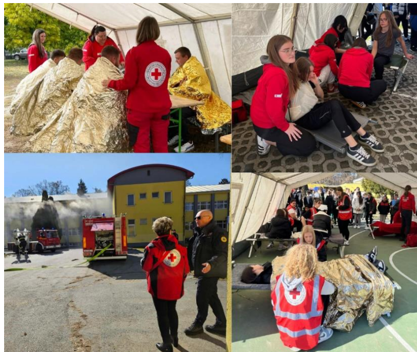
Slika 5 Pokazna vježba u kojima je tijekom 2025. godine sudjelovalo GDCK Valpovo