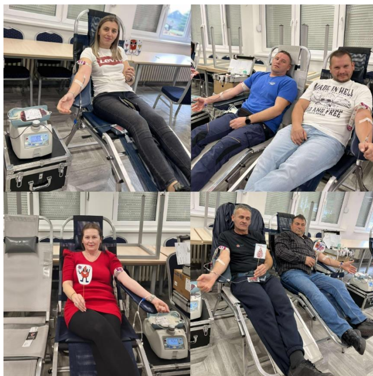
Slika 14 Akcija DDK u Belišću

Hrvatski Crveni križ Gradsko društvo Crvenog križa Valpovo, povodom Dana dobrovoljnih davatelja krvi u Republici Hrvatskog – 25. listopada, svake godine, tradicionalno organizira prigodnu svečanost. Prema Pravilniku o priznanjima Hrvatskog Crvenog križa koji je donesen na temelju članka 39. Statuta Hrvatskog Crvenog križa, dodjeljuju se priznanja Hrvatskog Crvenog križa za višestruko danu krv.