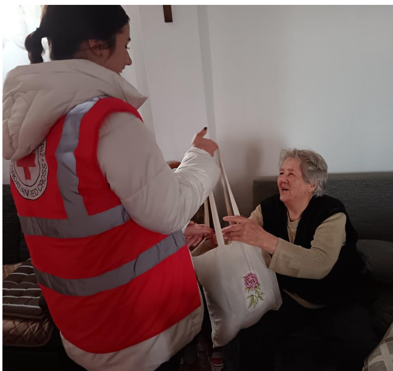
Slika 1 Volonterka i korisnica Pomoći u kući

Djelujući u skladu s temeljnim načelima Međunarodnog pokreta Crvenog križa i Crvenog polumjeseca, Hrvatski Crveni križ Gradsko društvo Crvenog križa Valpovo potiče dobrovoljnost i solidarnost, štiti dostojanstvo, život i zdravlje te bez diskriminacije pomaže čovjeku u potrebi 2 .