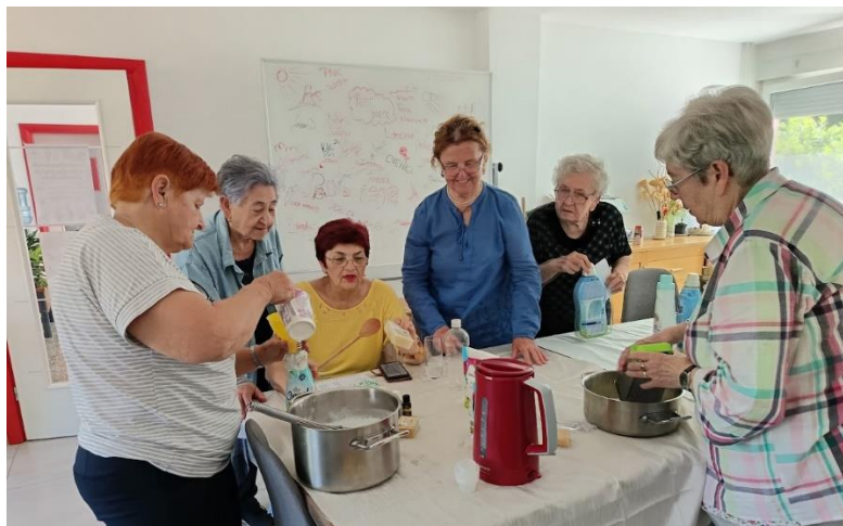
Slika 32 Edukativna radionica izrade domaćeg eko deterdženta za pranje rublja

Također, voditeljica Dnevnog boravka organizirala i dvije edukativne eko - radionice. Povodom Dana planeta Zemlje održana je radionica izrade eko omekšivača za rublje, dok je povodom Svjetski dan zaštite okoliša organizirana radionica izrade prirodnog deterdženta za rublje. Kroz radionice, uz savjete i recepte korisnici su se informirali i potaknuli na izradu vlastitih prirodnih i ekoloških sredstava za pranje rublja, koja su pohranjena u ponovno upotrijebljenoj plastičnoj ambalaži, čime se potaknulo na ponovno korištenje plastike i na smanjenje nepotrebnog otpada.