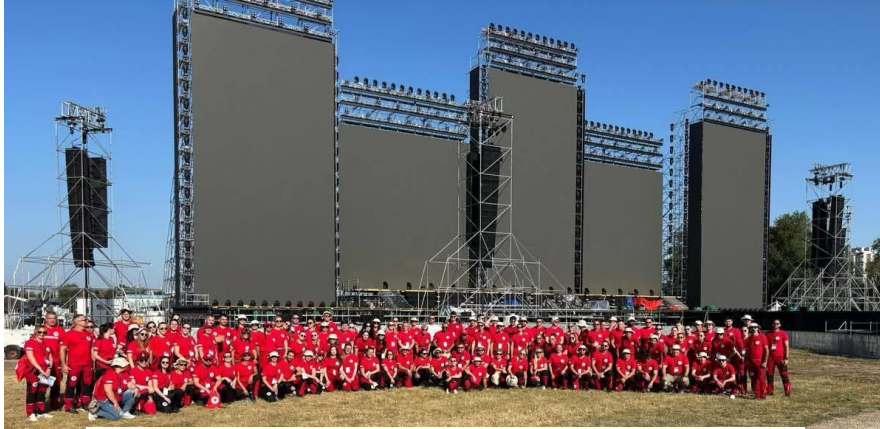
Slika 8 Dežurstvo na zagrebačkom Hipodromu 2025. godine

Đakovačko-osječke nadbiskupije, proslavi obljetnice krunjenja Majke Tripud Divne, stolnoteniskom turniru, obilježavanju dana hrvatskih branitelja grada Belišća, Ljetu valpovačkom, županijskom vatrogasnom natjecanju, Volonteri i zaposlenici GDCK Valpovo sudjelovali su i na dežurstvu na SeaStar festivalu u Umagu kao pomoć volonterima i zaposlenicima GDCK Buje te je jedna volonterka sudjelovala na dežurstvu tijekom jednog od najvećih glazbenih događaja održanih na zagrebačkom Hipodromu.