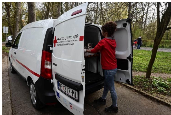
Slika 37 Dostava kuhanih obroka