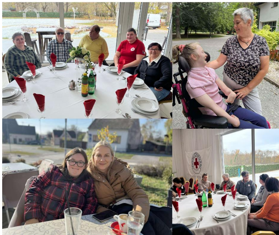
Slika 50 Zaposlenice i korisnici projekta "Snaga podrške - Crveni križ Valpovo"