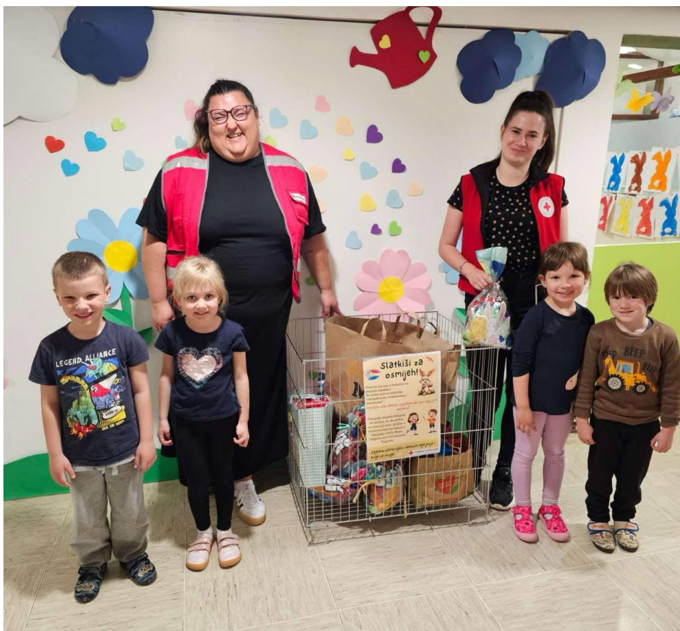
Slika 41 Donacija - Dječji vrtić Maza Valpovo

Registar posrednika u lancu doniranja hrane vodi Ministarstvo poljoprivrede, šumarstva i ribarstva, a u Registar moraju biti upisane sve pravne osobe koje namjeravaju obavljati poslove posrednika u lancu doniranja hrane. Kroz program Hrvatskog Crvenog križa „Za dostojanstven život“ kupljena su i podijeljena drva za ogrjev osobama starije životne dobi. Ova pomoć osigurava toplinu i osnovne uvjete za grijanje onima kojima je najpotrebnije.