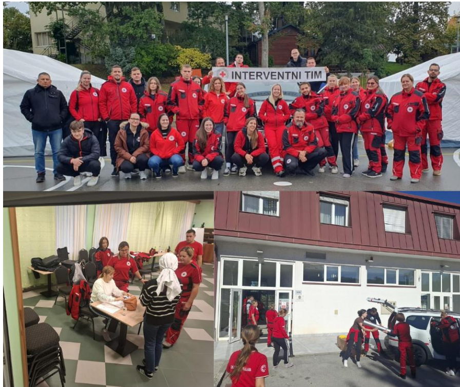
Slika 6 Edukacija za članove Osnovne jedinice interventnog tima DCK OBŽ 2025. godine

Tijekom 2025. godine, volonteri i zaposlenici GDCK Valpovo sudjelovali su na edukacijama za sudjelovanje u međunarodnim operacijama civilne zaštite, edukaciji za članove Osnovne jedinice interventnog tima Društva Crvenog križa Osječko-baranjske županije, treningu za trenere terenske jedinice mladih i treningu za članove terenske jedinice mladih GDCK Valpovo.