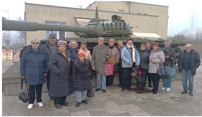
Slika 33 Korisnici Dnevnog boravka Crvenog križa Valpovo ispred tenka kod Spomen doma hrvatskih branitelja na Trpinjskoj cesti