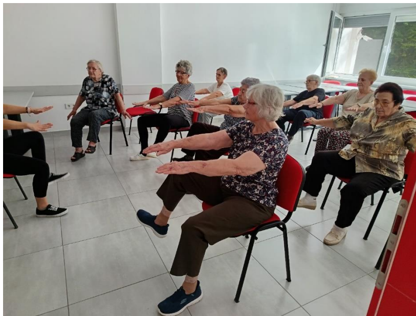
Slika 28 Tjelovježba za osobe starije životne dobi

Korisnici Dnevnog boravka Crvenog križa Valpovo najveći su interes pokazali za radionice usmjerene na očuvanje zdravlja korisnika: redovite vođene tjelovježbe za osobe starije životne dobi, koje su se održavale svake srijede, te aktivnosti mjerenja krvnog tlaka i glukoze u krvi, koje su održavale svakog četvrtka u Dnevnom boravku Crvenog križa Valpovo.