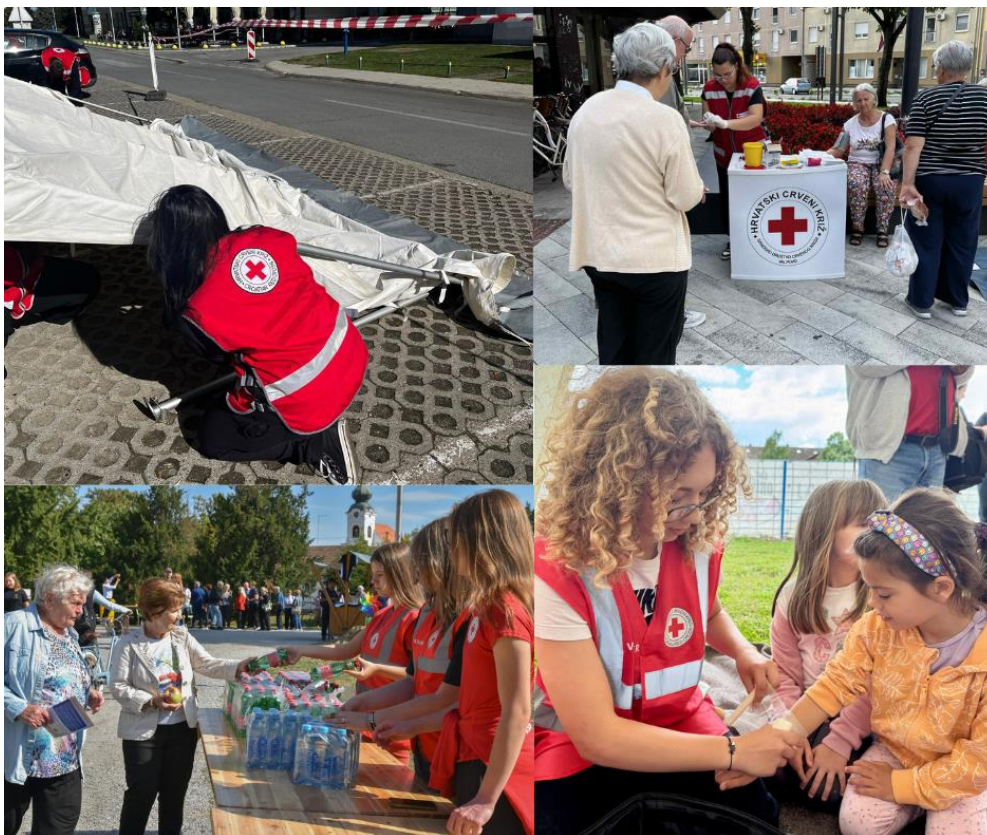
Slika 23 Aktivnosti Kluba mladih GDCK Valpovo u 2025. godini