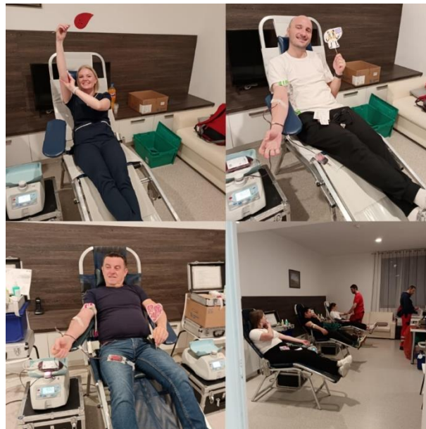
Slika 11 Akcije DDK Bizovac

Obavijesti kojima su se pozivali građani na akcije DDK, a koje je pripremala stručna služba Gradskog društva Crvenog križa Valpovo, objavljivane su i putem Hrvatskog radija Valpovštine, Gradskog radija Belišće, portala www.valpovstina.info , službene Web i Facebook stranice GDCK Valpovo te Instagram profila društva. Osim pozivanja davatelja na akcije DDK, napravljeni su različiti videozapisi kao i ostale objave kako bi animirale potencijalne, ali i zahvalili dosadašnjim dobrovoljnim davateljima koji kontinuirano daruju krvi. Objave se nalaze na prethodno spomenutim stranicama, ali i na rastućoj društvenoj mreži - Tik Tok.