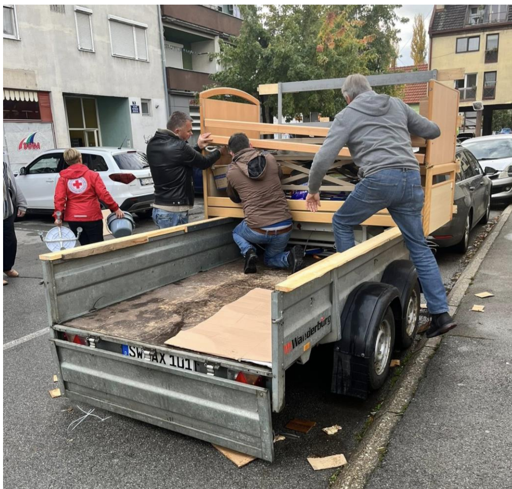
Slika 20 Istovar donacije ortopedskih pomagala 2025. godine

Tijekom 2025. godine broj aktivnih volontera u GDCK Valpovo je 83 od čega su 72 žene i 11 muškaraca. Volontera u dobi do 14 godina bilo je 7, u dobi od 15 do 17 godina 38, u dobi od 18 do 30 godina 29, u dobi od 31 do 45 godina 4, u dobi od 46 do 65 godina 3 te u dobi od 66 godina i više 2 volontera.