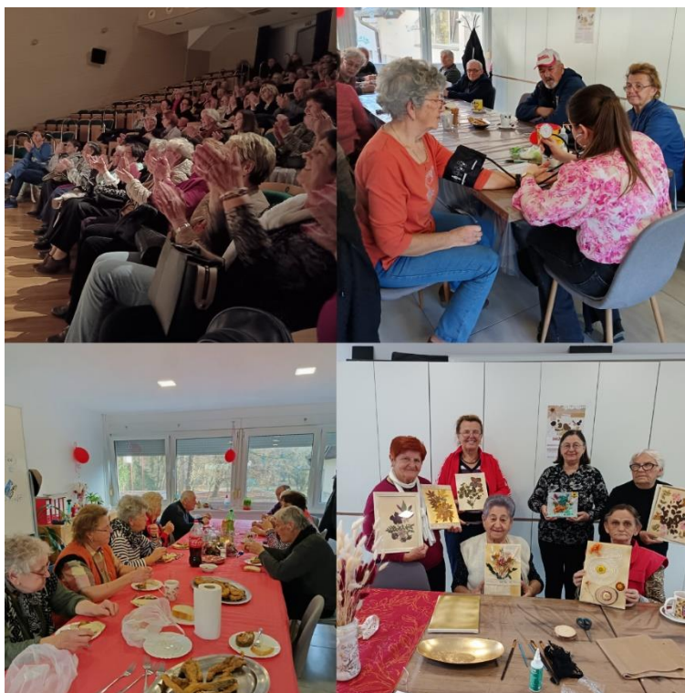
Slika 47 Dnevni boravak - Crveni križ Valpovo

Valpovštine. Provodile su se sportsko-rekreativne, kreativne, edukacijske i informativne radionice, kulturne i zabavne aktivnosti te kombinacija svega navedenog.