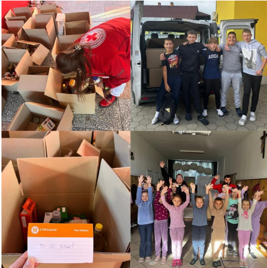
Slika 40 Solidarnost na djelu 2025.