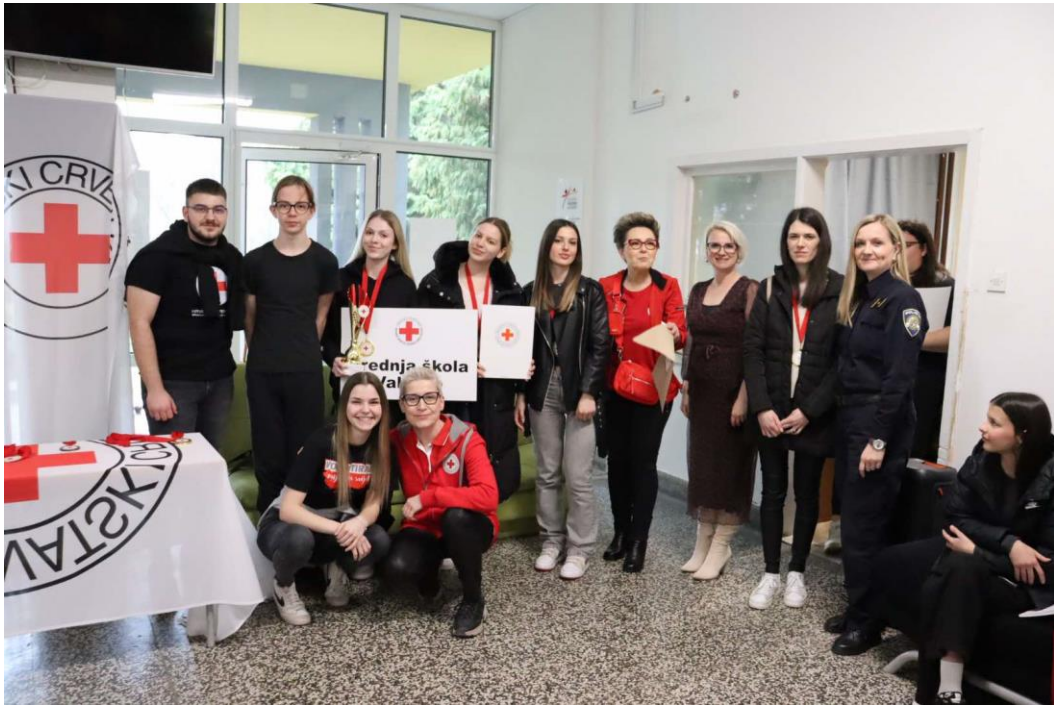
Slika 26 Ekipa u kategoriji mladih SŠ Valpovo s mentoricom na Gradskom natjecanju mladih HCK 2025. godina

Na međužupanijskoj razini koja je održana 12. travnja 2025. godine u Slatini, ekipa Srednje škole Valpovo osvojila je 3. mjesto u kategoriji mladih dok je ekipa OŠ Ladimirevci osvojila 3. mjesto u kategoriji podmlatka.