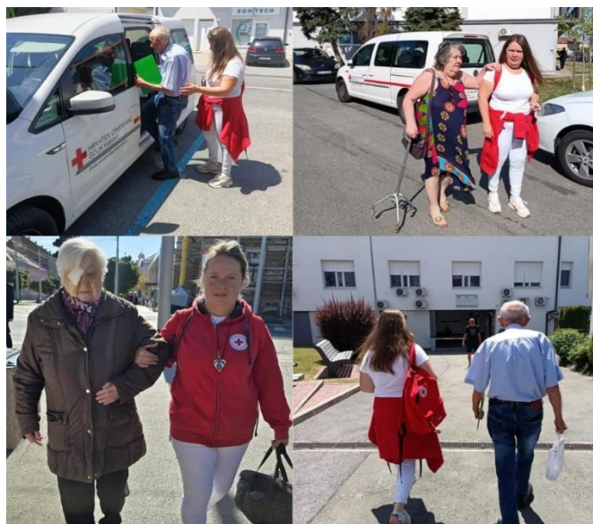
Slika 34 Mobilni uz nas - Crveni križ Valpovo

Projekt se provodi uz financijsku podršku Ministarstva rada, mirovinskog sustava, obitelji i socijalne politike, u partnerstvu s lokalnim jedinicama vlasti, a korisnici ga koriste redovito, uključujući i situacije kada volonteri GDCK Valpovo pružaju dodatnu pomoć pri dolasku i odlasku. Kroz ovu uslugu, Crveni križ osigurava da starije osobe imaju siguran, pouzdan i prijateljski pristup potrebnim uslugama, čime se jača njihova povezanost s lokalnom zajednicom i osjećaj sigurnosti. Tijekom 2025. godine 190 korisnika je koristilo uslugu prijevoza.