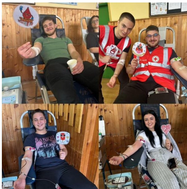
Slika 10 Akcija DDK Srednja škola Valpovo, 1. travnja 2025. godine

Promidžba i najave akcija obavljaju se putem: dopisnica, plakata, obavijesti u svim župama s područja Valpovštine na nedjeljnim misama, preko povjerenika i predsjednika mjesnih osnovnih društava Crvenog križa, mladih Crvenog križa, preko učenika u školama te obavijestima na službenim stranicama SŠ Valpovo.