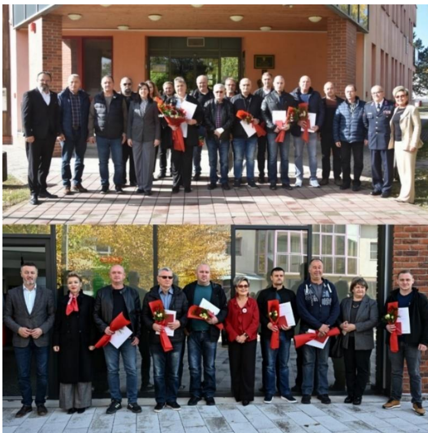
Slika 16 Svečanost, 2025. godine, povodom Dana dobrovoljnih davatelja krvi u RH - 25. listopada

Red Danice hrvatske je odlikovanje Republike Hrvatske koje zauzima četrnaesto mjesto u važnosnom slijedu hrvatskih odlikovanja. Red je ustanovljen 10. ožujka 1995. godine. Red se dijeli na sedam jednako vrijednih odlikovanja, a dobrovoljnim darivateljima krvi uručuje se Red Danice hrvatske s likom Katarine Zrinske – dodjeljuje se hrvatskim i stranim državljanima za osobite zasluge za zdravstvo, socijalnu skrb i promicanje moralnih društvenih vrednota.