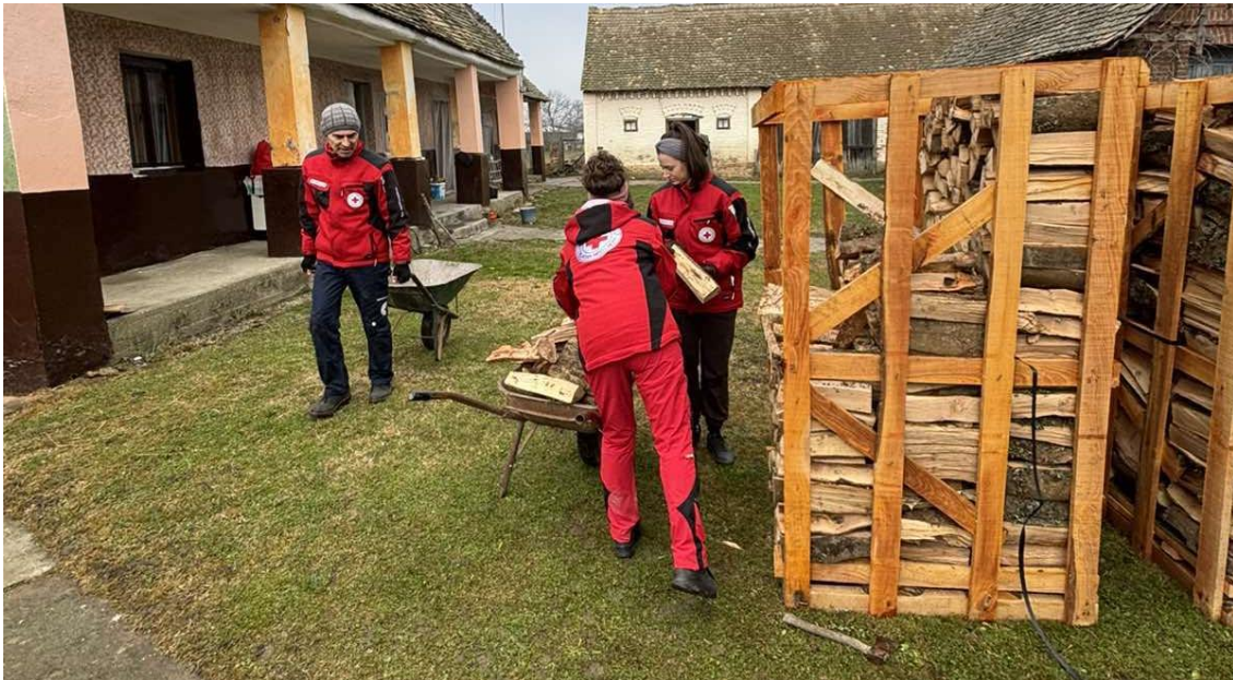
Slika 35 Pomoć u kući