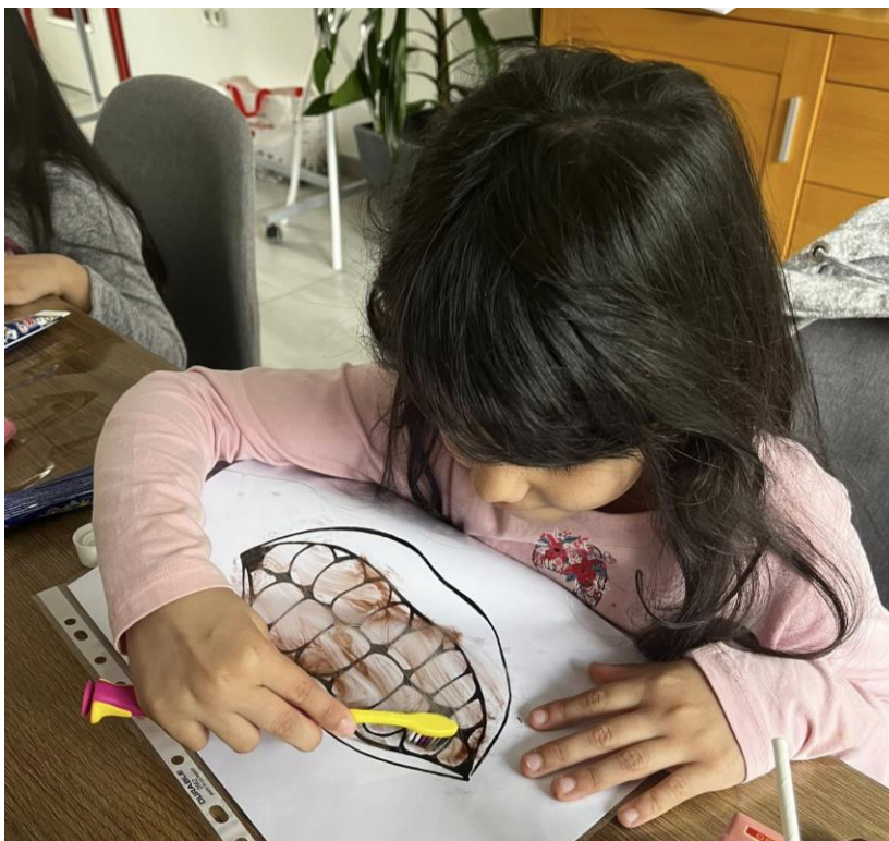
Slika 19 Radionica o važnosti osobne higijene, pravilnog pranja ruku i zubi s djecom romske nacionalne manjine 2025. godine

Tijekom 2025. godine maturanti su educirani o važnosti dobrovoljnog davanja krvi kroz šest radionica održanih u Srednjoj školi Valpovo, u kojima je sudjelovalo 87 učenika, dok je na temu prevencije ovisnosti provedeno 16 radionica s ukupno 290 sudionika. Povodom Svjetskog dana zdravlja, u okviru projekta „Snažni i jednaki“, koji se provodio s romskom djecom i ženama, s djecom je održana radionica o važnosti osobne higijene, pravilnog pranja ruku i zubi.