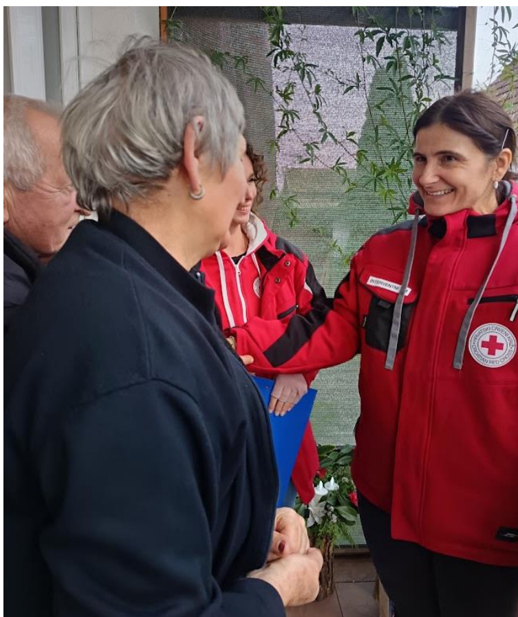
Slika 36 Pomoć u kući