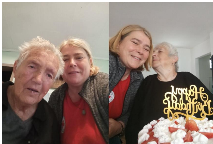
Slika 43. Korisnice i gerontodamacica projekta Zaželi - Prevencija institucionalizacije.