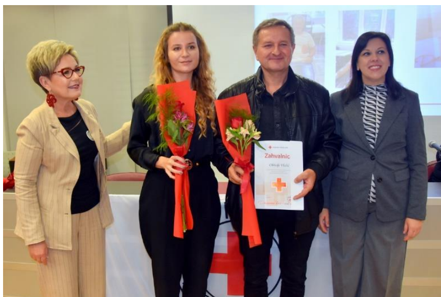
Slika 15 Obiteljska zahvalnica

Hrvatski Crveni križ Gradsko društvo Crvenog križa Valpovo, povodom Dana dobrovoljnih davatelja krvi u Republici Hrvatskog – 25. listopada, svake godine, tradicionalno organizira prigodnu svečanost. Prema Pravilniku o priznanjima Hrvatskog Crvenog križa koji je donesen na temelju članka 39. Statuta Hrvatskog Crvenog križa, dodjeljuju se priznanja Hrvatskog Crvenog križa za višestruko danu krv.