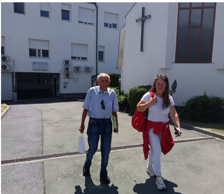
Slika 46 Mobilni u nas - Crveni križ Valpovo

Projekt se provodi uz financijsku podršku Ministarstva rada, mirovinskog sustava, obitelji i socijalne politike, u partnerstvu s lokalnim jedinicama vlasti, a korisnici ga koriste redovito, uključujući i situacije kada volonteri GDCK Valpovo pružaju dodatnu pomoć pri dolasku i odlasku. Kroz ovu uslugu, Crveni križ osigurava da starije osobe imaju siguran, pouzdan i prijateljski pristup potrebnim uslugama, čime se jača njihova povezanost s lokalnom zajednicom i osjećaj sigurnosti. Tijekom 2025. godine 190 korisnika je koristilo uslugu prijevoza.