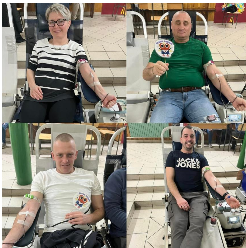
Slika 13 Akcija DDK u Ladimirevcima

Tijekom 2025. godine GDCK Valpovo organiziralo je i provelo 26 akcija dobrovoljnog davanja krvi. U sljedećoj tablici je moguće vidjeti planirani i ostvareni broj darivatelja po mjestima održavanja akcija darivanja krvi.