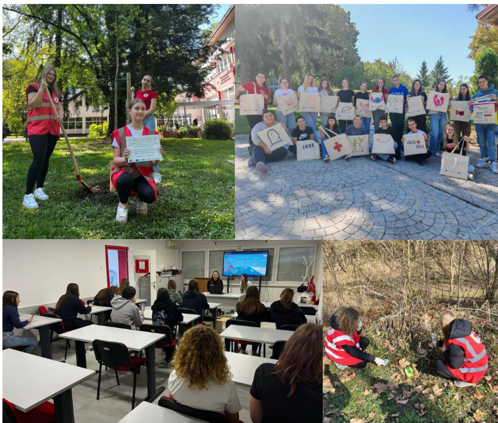
Slika 45 Aktivnosti u okviru projekta "Educiraj, prenesi, zelenije sutra donesi"